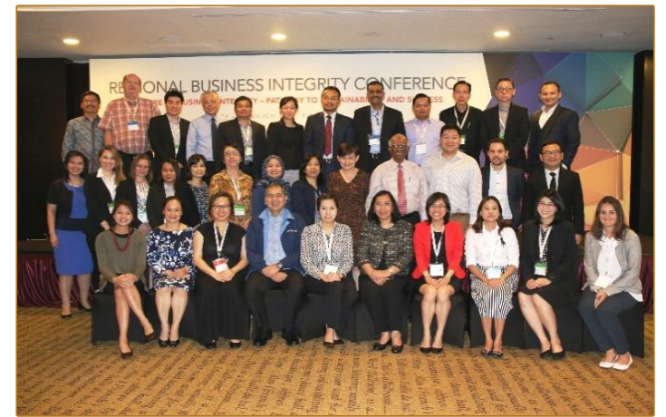
Regional Business Integrity Conference, Culture of Business Integrity- Highway to Sustainability and Success, Singapore