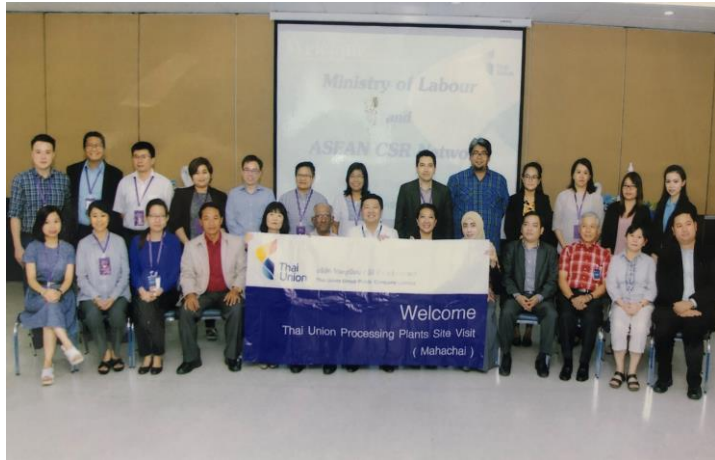
ร่วมกับกระทรวงแรงงานและ ASEAN CSR Network จัดศึกษาโรงงานด้าน Human Rights มจ. ไทยยูเนี่ยน กรุ๊ป ให้แก่ผู้เข้าร่วมงาน ASEAN CSR on Labour Forum