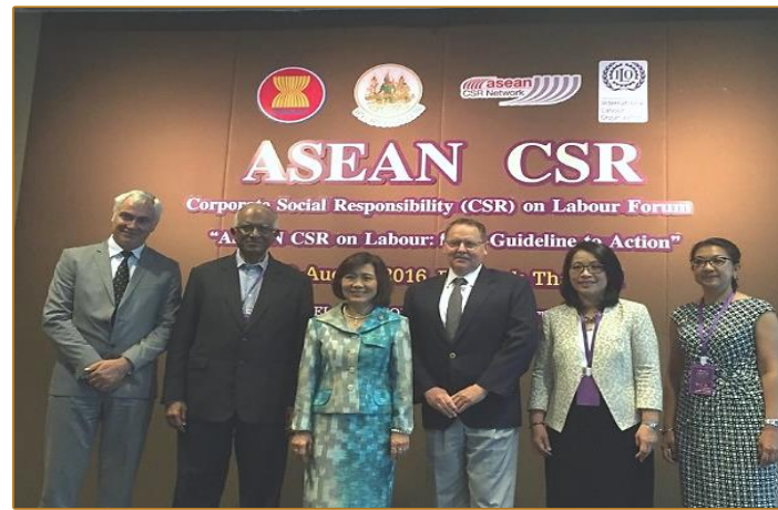
TLCA with ACN had also been active in providing its expertise. Apart from conferences, research, ACN was also an active contributor to the ASEAN Guidelines for CSR on Labour, Vientiane