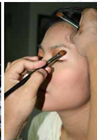
Support Academy Fantasia Season 6's contest by Covermark