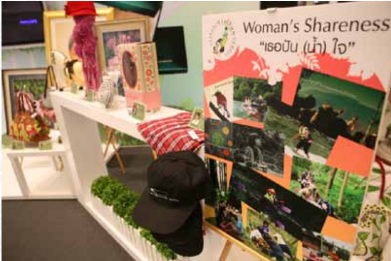
Hold charity event to donate 2% of the amount receiving form Covermark Natural Fix and Moisture Veil' s distribution and the sale of beloved stuffs belonging to the actors and actress to the Rabbit in the Moon Foundation