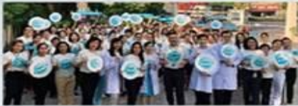
รพ.สมิติเวช ธนบุรี จัดงานรณรงค์ "Save Life Save 1,000,000" สำหรับลดอุบัติเหตุบนท้องถนน

รพ.สมิติเวช ธนบุรี จัดงานรณรงค์ "Save Life Save 1,000,000" สำหรับลดอุบัติเหตุบนท้องถนน โดยรณรงค์ให้ประชาชนลดการดื่มเครื่องดื่มแอลกอฮอล์ก่อนขับรถ และลดการขับรถเร็วเกินไป