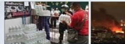
โรงพยาบาลสมิติเวช ธนบุรี ส่งน้ำใจมอบน้ำดื่ม ช่วยพี่น้องผู้ประสบภัยภัย

รพ.สมิติเวช ธนบุรี ได้ส่งน้ำใจมอบน้ำดื่มให้แก่ผู้ประสบภัยภัย โดยได้นำน้ำดื่มไปแจกจ่ายให้แก่ผู้ประสบภัยภัยที่ประสบภัยภัยจากน้ำท่วม