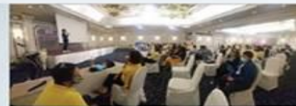
โรงพยาบาลสมิติเวช ธนบุรี ออกบูธกิจกรรม งานประชุมตัวแทนประกัน AIA

เมื่อวันที่ 10 กุมภาพันธ์ 2563 รพ.สมิติเวช ธนบุรี ได้ออกบูธกิจกรรมงานประชุมตัวแทนประกัน AIA โดยให้บริการตรวจวัดความดันโลหิต ตรวจวัดไขมันในเลือด ตรวจวัดน้ำตาลในเลือด และให้บริการให้คำปรึกษาเกี่ยวกับสุขภาพ