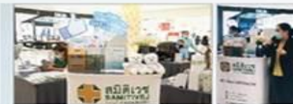
โรงพยาบาลสมิติเวช ธนบุรี ร่วมกิจกรรม ICONSIAM Happy Health Market

รพ.สมิติเวช ธนบุรี ได้ร่วมกิจกรรม ICONSIAM Happy Health Market โดยให้บริการตรวจวัดความดันโลหิต ตรวจวัดไขมันในเลือด ตรวจวัดน้ำตาลในเลือด และให้บริการให้คำปรึกษาเกี่ยวกับสุขภาพ