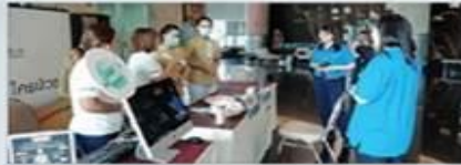
รพ.สมิติเวช ธนบุรี ออกบูธบริการด้านสุขภาพ อาคารศูนย์สุขภาพนานาชาติเออีซี

เมื่อวันที่ 5 กุมภาพันธ์ 2563 รพ.สมิติเวช ธนบุรี ได้ออกบูธบริการด้านสุขภาพ อาคารศูนย์สุขภาพนานาชาติเออีซี โดยให้บริการตรวจวัดความดันโลหิต ตรวจวัดไขมันในเลือด ตรวจวัดน้ำตาลในเลือด และให้บริการให้คำปรึกษาเกี่ยวกับสุขภาพ