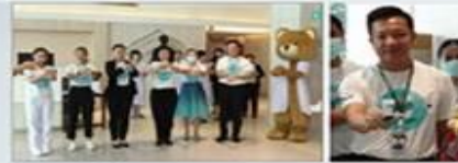
โรงพยาบาลสมิติเวช ธนบุรี จัดกิจกรรมรณรงค์การลดอุบัติเหตุ

เมื่อวันที่ 14 กุมภาพันธ์ 2563 รพ.สมิติเวช ธนบุรี ได้จัดกิจกรรมรณรงค์การลดอุบัติเหตุ โดยมีการแจกจ่ายโปสเตอร์และใบปลิวเกี่ยวกับความปลอดภัยบนท้องถนน