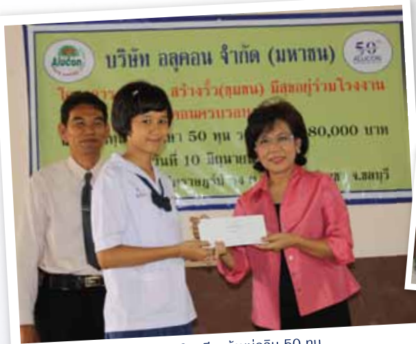
มอบทุนการศึกษาโรงเรียนบ้านบ่อวิน 50 ทุน