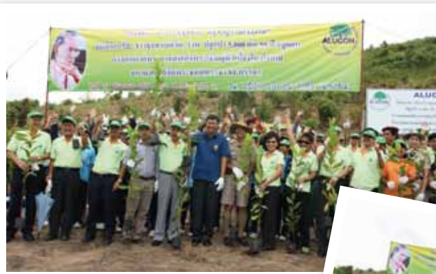
โครงการปลูกป่ารักษาสีเขียวสิ่งแวดล้อมชุมชนบ่อวิน 5,000 ต้น (ฉลองครบรอบ 50 ปีออลคอน)