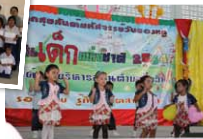
จัดงานวันเด็กแห่งชาติร่วมกับอบต.บ่อวิน