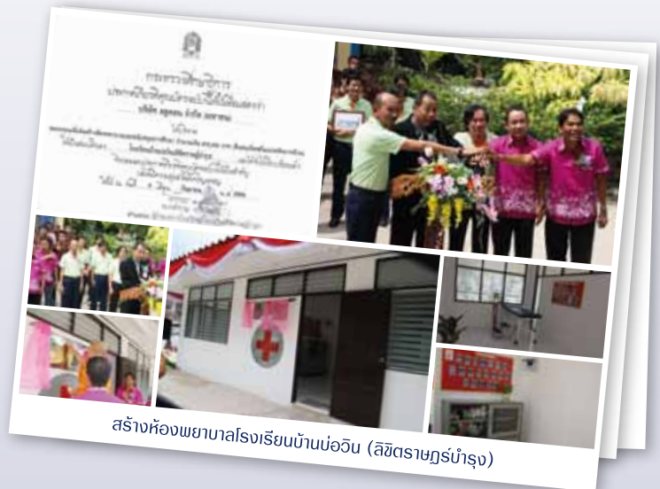
สร้างห้องพยาบาลโรงเรียนบ้านบ่อวิน (ลิขิตราษฎร์บำรุง)