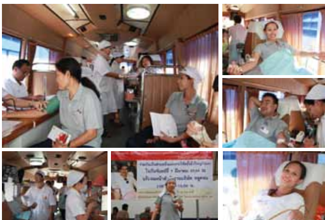
บริการโลหิตโดยพนักงานออลคอนทั้งลำโรงและศรีราชา