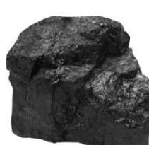
ซับบิทูมินัส