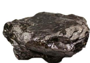
แอนทราไซต์

การจำแนกประเภทของถ่านหินมีหลายระบบ แตกต่างกันไปตามจุดประสงค์ของการใช้งาน แต่ระบบที่เป็นที่นิยมใช้กันในปัจจุบันได้แก่ ระบบของสมาคมทดสอบและวัสดุแห่งสหรัฐอเมริกา (American Society for Testing and Materials, ASTM) โดยได้จำแนกถ่านหินเป็น 4 ประเภทตามปริมาณของธาตุคาร์บอนจากมากที่สุดไปน้อยที่สุดได้ดังนี้ แอนทราไซต์ (Anthracite) บิทูมินัส (Bituminous) ซับบิทูมินัส (Sub-Bituminous) และลิกไนต์ (Lignite) คุณสมบัติทั่วไปของถ่านหินที่อยู่ในลำดับสูง จะมีปริมาณคาร์บอนมาก ให้ความร้อนสูง มีไฮโดรเจนและออกซิเจนอยู่น้อย ในขณะที่ถ่านหินที่อยู่ลำดับต่ำ จะมีปริมาณคาร์บอนน้อย แต่มีไฮโดรเจนและออกซิเจนมาก ซึ่งแต่ละลำดับชั้นถูกแบ่งย่อยลงไปอีกตามคุณสมบัติทางเคมีและค่าความร้อนที่ต่างกันไป