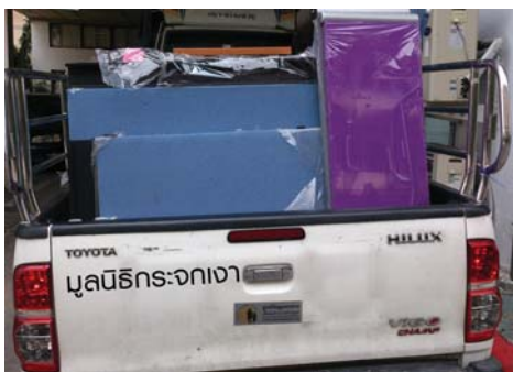
▶ บริษัทอุปกรณ์สำนักงานแก่มูลนิธิกระจกเงา

การสนับสนุนกิจกรรมด้านสังคมเป็นสิ่งที่บริษัทฯ มีส่วนร่วมเสมอมาโดยมีการบริจาคอุปกรณ์การเรียนและหนังสือให้แก่โรงเรียนในถิ่นทุรกันดารเป็นประจำทุกปี สนับสนุนกิจกรรมสมทบทุนต่างๆ นำเงินรายได้ไปบริจาคให้แก่คนพิการ ผู้ด้อยโอกาส รวมทั้งเด็กและเยาวชนที่อาศัยอยู่ในชุมชนและชนบทที่ห่างไกลความเจริญเพื่อปรับปรุงคุณภาพชีวิตทางสังคมให้ดีขึ้นอย่างยั่งยืนต่อไป อย่างเช่น การบริจาคอุปกรณ์การเรียนและกีฬา และร่วมบริจาคเงินเข้ากองทุนตลาดหุ้นร่วมใจช่วยภัยน้ำท่วมเพื่อนำเงินไปฟื้นฟูโรงเรียนวัดช้างเหล็ก (พิบูลเกียรติ) อ.บางไทร จ.พระนครศรีอยุธยา ที่ประสบอุทกภัยน้ำในปี 2554 ซึ่งการฟื้นฟูโรงเรียนเสร็จสิ้นไปเมื่อเดือนกรกฎาคม 2556 ที่ผ่านมา