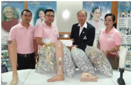
▶ โครงการ CAN แลกยา

ในแต่ละปี บริษัทฯ จะทำการจัดสรรงบประมาณส่วนหนึ่งเพื่อนำมาดำเนินกิจกรรมทางสังคมโดยเน้นการส่งเสริมด้านการศึกษาการทำนุบำรุงศาสนาและการส่งเสริมคุณภาพชีวิตทางสังคม โดยตลอดปี 2556 บริษัทฯ ได้ดำเนินกิจกรรมด้านการศึกษาทั้งหมด 4 โครงการ ด้านศาสนา 11 โครงการ และด้านการส่งเสริมคุณภาพสังคม 11 โครงการ ดังนั้น ในปี 2556 ได้ดำเนินกิจกรรมด้านความรับผิดชอบต่อสังคมโดยรวม 26 โครงการ