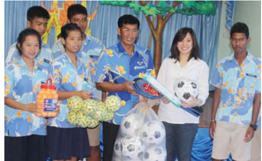
▶ โครงการ ตลาดหุ้นร่วมใจช่วยภัยน้ำท่วม

ตลอดปี 2556 ผู้บริหาร บล. คันทรี กรุ๊ป ได้ให้ความสำคัญและสนับสนุนกิจกรรมด้านพระพุทธศาสนาโดยตลอด อาทิ การร่วมทอดกฐินและผ้าป่า สมทบทุนสร้างพระเจดีย์ พระประธาน และมหาวิหารกับวัดในจังหวัดต่างๆ เพื่อเป็นประโยชน์แก่พระภิกษุและบุคคลทั่วไปในการปฏิบัติธรรมและประกอบ ศาสนกิจต่างๆ