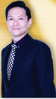
นายอภิรักษ์ วานิช ประธานกรรมการ