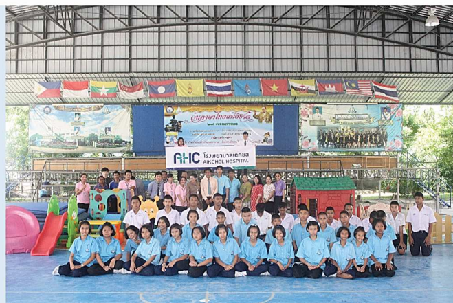
โครงการมอบของเล่นเด็ก โรงเรียนวัดเขาเชิงเทียนเทพาราม