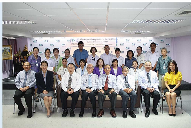
โครงการมอบทุน บุตรพนักงาน