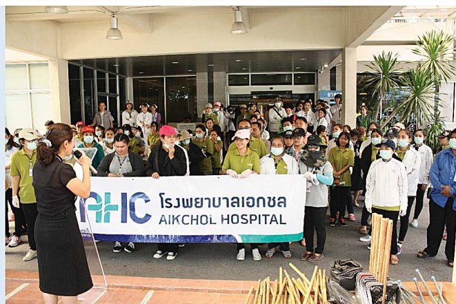
โครงการ Big Cleaning Day