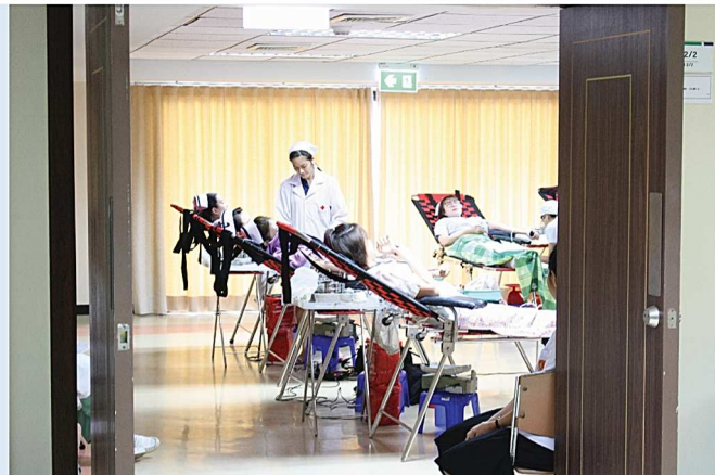
โครงการเลือด เอกชล