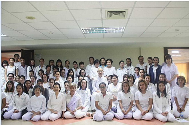
โครงการธรรมะรุ่น 6