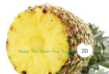
Malee The Green Fruit Expert

ผลิตภัณฑ์นมยูเอชที ของบริษัท ฯ มีสัดส่วน 13% ของกลุ่มธุรกิจนมของบริษัท มีการเติบโตที่ลดลง 23% ในขณะที่นมพาสเจอร์ไรส์มีสัดส่วน 87% แต่เติบโตที่ 17% จึงทำให้ภาพรวมของกลุ่มธุรกิจนมมีการเติบโตอยู่ 8% สาเหตุการถดถอยของตลาดนมยูเอชทีเนื่องมาจากสภาพตลาดที่เติบโตช้าลงและบริษัทมีช่องทางการขายที่ค่อนข้างจำกัด เมื่อเปรียบเทียบกับตลาดนมพาสเจอร์ไรส์ที่เติบโตสูงกว่า และมีการกระจายสินค้าที่เพิ่มมากขึ้นอย่างต่อเนื่องจากการเปิดเอเย่นต์เพิ่มขึ้น หรือกลยุทธ์การเจาะตลาดสำหรับผู้บริโภคนมพาสเจอร์ไรส์อยู่แล้วโดยการให้หน่วยงานทำการเสนอขายเชิงรุกตามพื้นที่ ทำการขายตรงแก่กลุ่มเป้าหมาย และกลยุทธ์การพัฒนาตลาดไปยังกลุ่มธุรกิจที่ใช้ผลิตภัณฑ์นมพาสเจอร์ไรส์เป็นวัตถุดิบในการผลิตสินค้า โดยในปี 2553 ทางบริษัท ได้ตั้งเป้าหมายการเติบโตทั้งนมยูเอชทีและนมพาสเจอร์ไรส์ ตราฟาร์มโชคชัย ด้วยการขยายฐานผู้บริโภคออกไปในกลุ่มใหม่ๆ มากขึ้น เพิ่มช่องทางการจัดจำหน่ายใหม่ๆ และใช้กลยุทธ์การพัฒนาผลิตภัณฑ์นมพาสเจอร์ไรส์ชนิดใหม่ที่มีคุณสมบัติที่ตอบสนองความต้องการของผู้บริโภคทำให้สามารถเพิ่มราคาจำหน่ายได้ด้วย