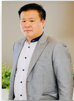
อายุ 33 ปี สัญชาติไทย