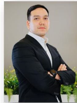
อายุ 40 ปี สัญชาติไทย