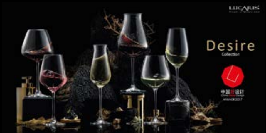
LUCARIS 'DESIRE COLLECTION' THE WINNER OF CHINA GOOD DESIGN AWARD 2017