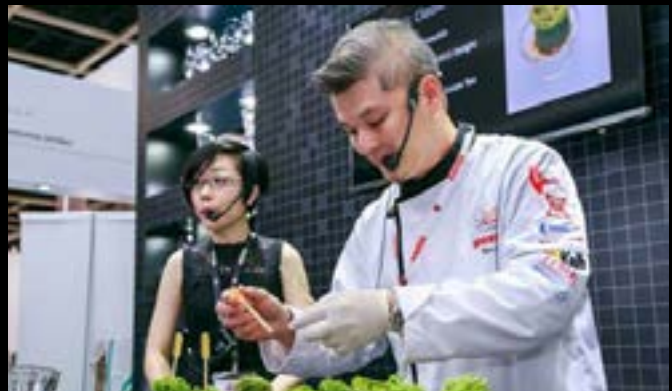
HOFEX 2017, Hong Kong