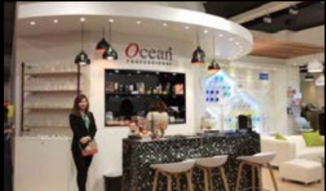
Ambiente 2017, Germany