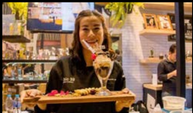
Makro Horeca 2017, Thailand