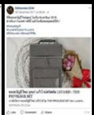
SOCIAL MEDIA MARKETING การตลาดตลาดออนไลน์