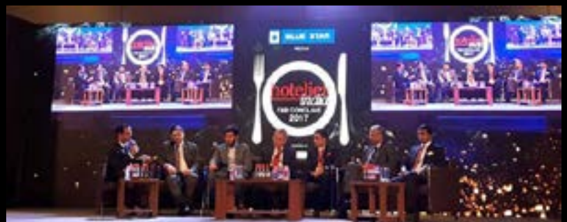
SPONSORSHIPS IN NATIONAL WINE & FOOD EVENTS ผู้สนับสนุนเครื่องแก้วคริสตัลในงานไวน์และอาหารระดับประเทศ