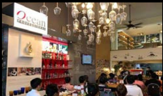
The Art of Coffee Creation Workshop, Thailand