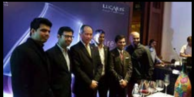
LUCARIS MASTER CLASS FEATURING DESIRE COLLECTION ลูคาริส มาสเตอร์คลาส กับ ดีไซน์เนอร์ คอลเลกชั่น