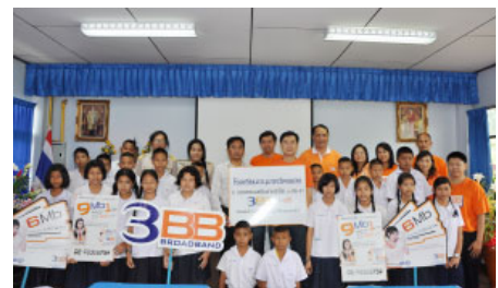
3BB ภาคตะวันตก จังหวัดราชบุรี ส่งมอบอินเทอร์เน็ตและ Wi-Fi ฟรี ให้กับโรงเรียน อนุบาลวัดเพลง จังหวัดราชบุรี

เนื่องด้วยตระหนักว่าการศึกษารากฐานสำคัญของการพัฒนาประเทศ กลุ่มบริษัทจัสมิน จึงเล็งเห็นความสำคัญในการมอบโอกาสทางการศึกษาให้กับเยาวชนผู้ด้อยโอกาส ผ่านโครงการ “3BB School” ซึ่งเป็นการมอบบรรดแบนด์อินเทอร์เน็ตและ Wi-Fi ให้แก่โรงเรียนห่างไกล และยังขาดทุนทรัพย์เพื่อใช้ในการเข้าถึงโลกอินเทอร์เน็ต เพื่อเป็นการเพิ่มโอกาสในการเรียนรู้และเปิดโลกทัศน์ในด้านต่างๆ ให้แก่เยาวชนทั่วประเทศ ทั้ง 77 จังหวัด ซึ่ง ณ วันที่ 31 มกราคม 2555 ได้ติดตั้งอินเทอร์เน็ตตามโรงเรียนต่างๆ แล้วเป็นจำนวน 196 โรงเรียน