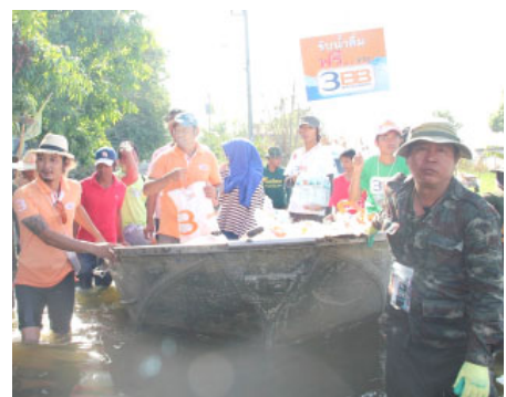
ทีมงาน 3BB กรุงเทพฯ เดินทางไปยังพื้นที่บางบัวทอง เพื่อมอบถุงยังชีพและน้ำดื่มให้แก่ผู้ประสบภัย

ในปี 2554 ที่ผ่านมา ประเทศไทยต้องเผชิญกับวิกฤตอุทกภัยทางธรรมชาติที่หนักหนาที่สุดอีกปีหนึ่ง ซึ่งเกิดขึ้นกับพื้นที่ในหลายๆ จังหวัดทั่วประเทศ ทั้งพื้นที่เกษตรกรรมและอุตสาหกรรมได้รับความเสียหายเป็นอย่างมาก กลุ่มบริษัทจัสมิน จึงได้เป็นส่วนหนึ่งที่เข้าไปช่วยเหลือผู้ประสบภัยในครั้งนี้ โดยได้รับความร่วมมือจากพนักงานของบริษัทต่างๆ ในเครือ ที่ช่วยสละแรงกายแรงใจเข้าช่วยเหลือผู้ประสบภัยในครั้งนี้ รวมถึงกลุ่มบริษัทจัสมินเองก็ได้ร่วมมอบเงินบริจาคช่วยเหลือผู้ประสบอุทกภัย ในนามบริษัท ทริปเปิลที บรอดแบนด์ จำกัด (มหาชน) หรือ 3BB เป็นจำนวนเงิน 1 ล้านบาท ผ่านทางครอบครัวข่าว 3 สำหรับอุทกภัยภาคใต้ และอีก 1 ล้านบาท เพื่อช่วยเหลือผู้ประสบอุทกภัยเมื่อเดือนตุลาคม 2554 ผ่านทางสำนักนายกรัฐมนตรี