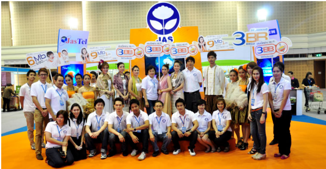
กลุ่มบริษัทจัสทิน ร่วมออกบูธประชาสัมพันธ์ ในงาน Chiangmai Invest Fair 2012 ม่วนตวย รวยदै

นอกเหนือจากนี้ ยังมีกิจกรรมสาธารณกุศลอื่นๆ อีกหลายกิจกรรมที่กลุ่มบริษัทฯ ได้เล็งเห็นถึงความสำคัญ อาทิเช่น