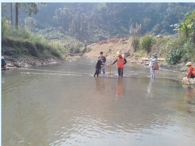
วัดความเร็วของกระแสน้ำ โดย FLOW METER