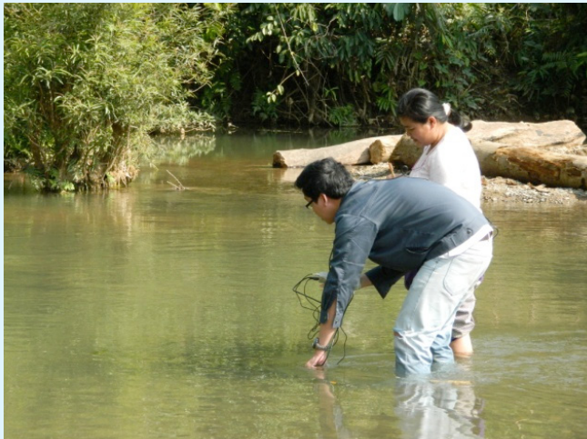
วัดค่า PH, DO, TEMP. โดยเครื่อง PH METER