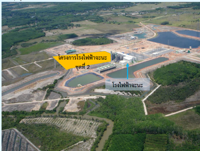
ภาพมุมสูงโครงการโรงไฟฟ้าจะนะ ชุดที่ 2