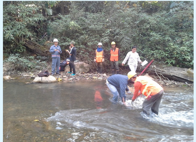
เก็บตัวอย่างน้ำเพื่อวัดความขุ่น โดยเครื่อง TURBIDITY METER