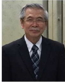
สารจากประธานกรรมการบริหาร

ตลอดปี พ.ศ. ๒๕๖๒ หลายประเทศทั่วโลกประสบภาวะเศรษฐกิจชะลอตัวอันมีเหตุมาจากผลกระทบจากหลายสาเหตุ เช่น กรณีสงครามทางการค้าระหว่างประเทศสหรัฐอเมริกากับประเทศสาธารณรัฐประชาชนจีนที่ทวีความรุนแรงและขยายขอบเขตมากขึ้น มีการตั้งกำแพงภาษีที่สูงจนผู้ส่งออกและผู้นำเข้าได้รับผลกระทบต่อระบบเศรษฐกิจของประเทศต่างๆ กรณีประเทศสหรัฐอเมริกาใช้มาตรการตั้งกำแพงภาษีสินค้าที่มาจากประเทศในแถบเอเชียรวมทั้งประเทศไทยและดัตช์อีไอเอสพีที่ให้แก่ประเทศไทย กรณีการรวมกลุ่มของสหรัฐอเมริกาและกลุ่มอื่นๆ เพื่อสกัดกั้นห้ามค้าขายกับอิหร่าน นอกจากนี้ ยังเกิดความลังเลในการค้าการลงทุนในกรณีที่สหราชอาณาจักรอังกฤษจะออกจากกลุ่มอียู เป็นต้น วิกฤติการณ์ทางเศรษฐกิจเหล่านี้มีผลต่ออัตราการเจริญเติบโตทางเศรษฐกิจทั่วโลก ก่อให้เกิดผลกระทบตลาดส่งออกของไทย นอกจากนี้ การลงทุนภาครัฐในโครงการใหญ่ประเภทเมกะโปรเจกต์เกิดการล่าช้าไปหลายโครงการ จึงเป็นเหตุที่เป็นอุปสรรคภายนอกทำให้การดำเนินธุรกิจชะลอตัวลง ทำให้บริษัทขาดทุน ๗.๒๗ ล้านบาท