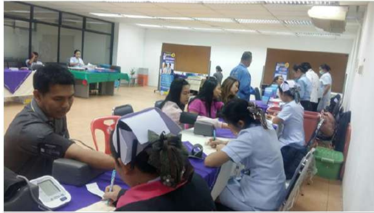
ภาพการตรวจสอบสภาพพนักงาน เมื่อวันที่ 12 พฤศจิกายน 2562