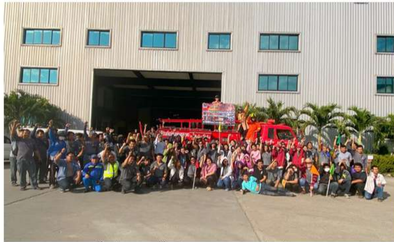
หลักสูตรการฝึกอบรมผู้บังคับปั้นจั่น ชนิดปั้นจั่นหอดสูง รถ เรือปั้นจั่น ผู้ให้สัญญาณแก่ผู้บังคับปั้นจั่น ผู้ยึดเกาะวัสดุผู้ควบคุม ระหว่างวันที่ 26-27 เม.ย.62 , 26-27 ก.ค.62 และ 25 ต.ค.62