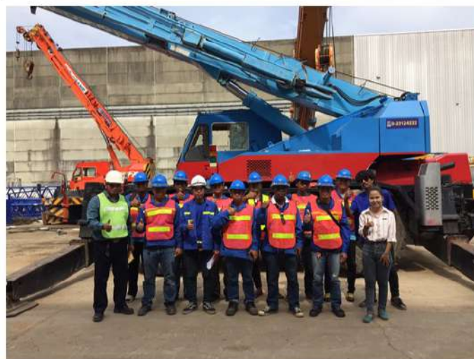
จัดส่งผู้ควบคุมเครื่อรณเข้าร่วม “กิจกรรมสัมนาผู้ประกอบการรณเครื่อรณทำงานไกลไฟฟ้าแรงสูง” กับการไฟฟ้านครหลวง วันที่ 25 กันยายน 2562