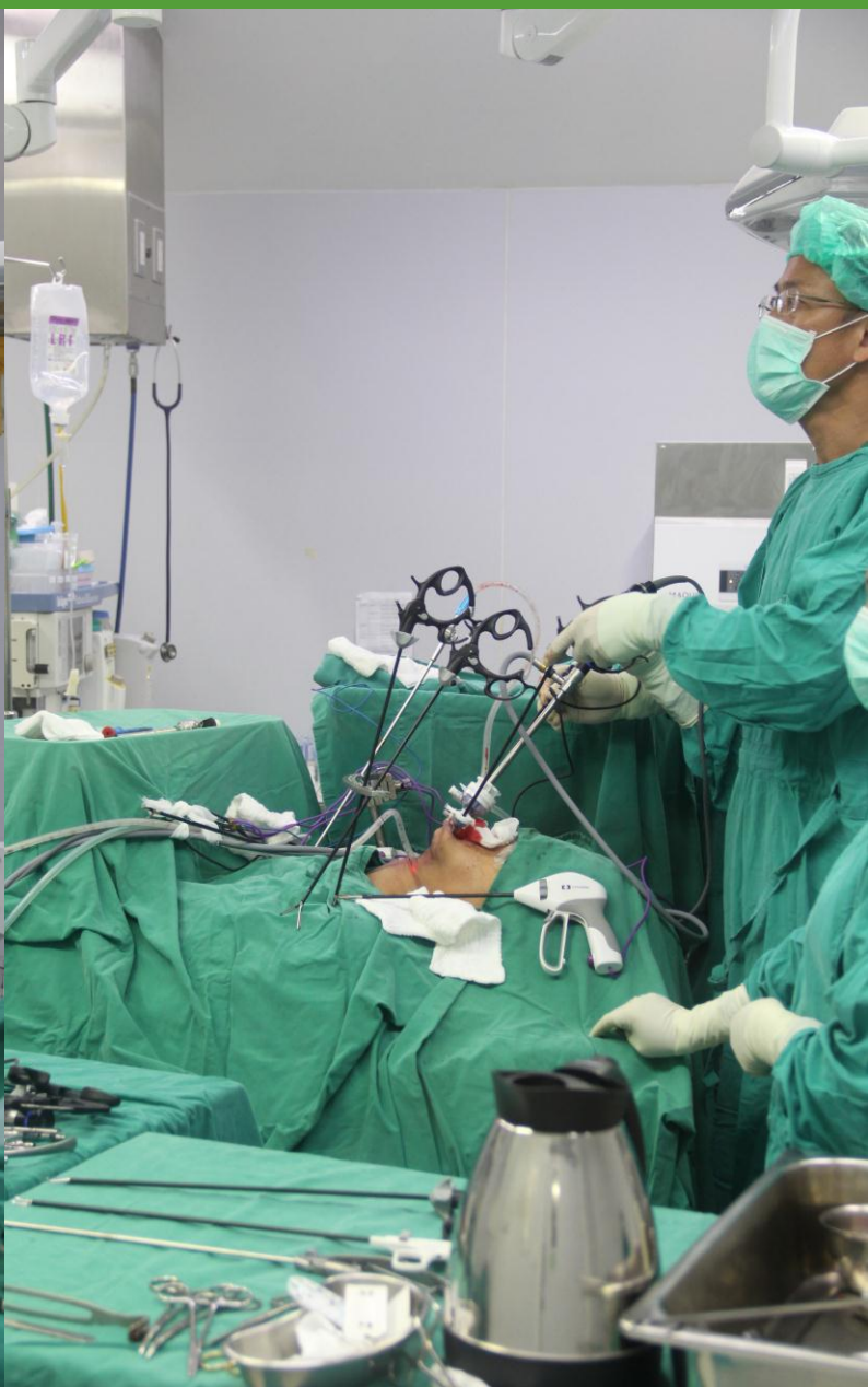
ศัลยกรรมผ่าตัดผ่านกล้อง (Minimally Invasive Surgery)