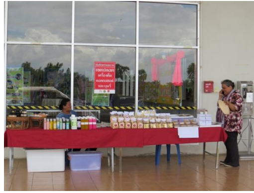
กิจกรรมส่งเสริมการเห็นคุณค่าของผู้ปฏิบัติงานและครอบครัว “ตลาดนัดชุมชน”