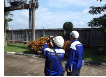
การตรวจสอบอาคารและระบบไฟฟ้าประจำปี