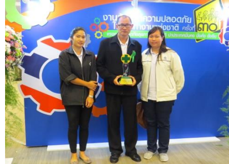
รางวัล สปก. ต้นแบบดีเด่นประจำปี 2559