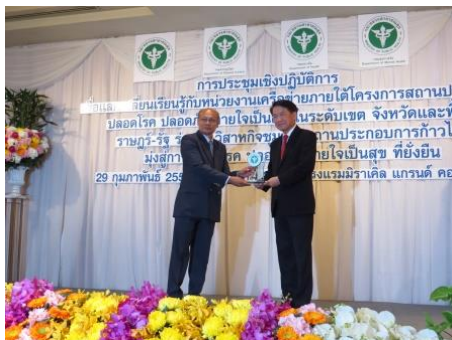
รางวัลสถานประกอบการปลอดโรค ปลอดภัย ใจเป็นสุข ระดับประเทศ