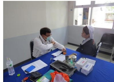
มีแพทย์ให้บริการปรึกษาเรื่องสุขภาพ