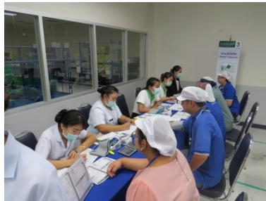
การตรวจสุขภาพของพนักงานต่อเนื่องทุกปี

ด้านสวัสดิการ การรักษาพยาบาลและความปลอดภัย ถือเป็นความรับผิดชอบต่อของบริษัท ที่จะต้องดูแลสวัสดิภาพของพนักงาน และรักษาสภาพการทำงานให้เป็นไปโดยถูกต้อง ปลอดภัย และถูกสุขลักษณะ และยึดมั่นในการปฏิบัติตามกฎหมายที่เกี่ยวข้องกับแรงงานอย่างเคร่งครัด พร้อมทั้งคำนึงถึงสวัสดิภาพที่ดีของพนักงานเป็นสำคัญ