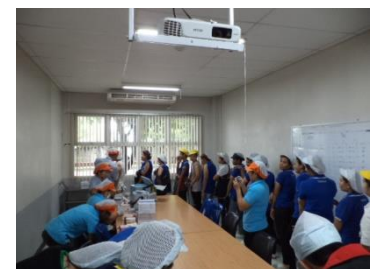
การรณรงค์ฉีดวัคซีนป้องกันโรคหัดเยอรมัน