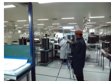
การตรวจวิเคราะห์คุณภาพด้านสิ่งแวดล้อม