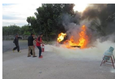
การฝึกอบรมดับเพลิงขั้นต้นและการฝึกซ้อมดับเพลิง

ด้านการร้องเรียน เปิดโอกาสให้มีการร้องเรียนของพนักงานต่อบริษัท ในเรื่องที่ไม่ได้รับความเป็นธรรม มีการปฏิบัติที่ไม่ถูกต้อง หรือมีการละเลยไม่ปฏิบัติตามข้อบังคับการทำงานหรือสัญญาหรือข้อตกลงที่ร่วมกันจัดทำไว้ โดยมีการกำหนดเป็นแนวทางให้ผู้ร้องทุกข์ได้ปฏิบัติตามขั้นตอน หรือกระบวนการร้องทุกข์ที่บริษัท กำหนดไว้ในข้อบังคับเกี่ยวกับการทำงานของบริษัท