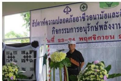
จัดงานสัปดาห์รณรงค์ ความปลอดภัยในการทำงาน