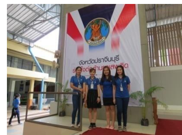
เข้าร่วมทำกิจกรรมโครงการ มยส. และกิจกรรมต่อต้านยาเสพติด 2559

นอกจากนี้ บริษัท ริเริ่มโครงการส่งเสริมการสร้างรายได้และเศรษฐกิจแบบพึ่งพาระหว่างผู้ใช้แรงงานกับผู้ประกอบการค้า ในชุมชนเพื่อการยังชีพรายย่อย โดยจัดให้มีตลาดนัดขึ้นภายในโรงงานทุกวันเงินเดือนออก โดยพนักงานจะได้ซื้อสินค้าอุปโภค บริโภคที่มีคุณภาพและราคาถูกกว่าท้องตลาด