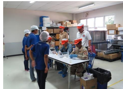
การสุ่มตรวจสอบสารเสพติด