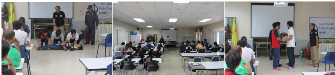
การจัดฝึกอบรมปฐมพยาบาลและปฏิบัติการช่วยชีวิตขั้นพื้นฐาน

บริษัท ยังให้ความสำคัญกับการให้ความรู้กับพนักงานตามความจำเป็นที่พนักงานต้องได้รับการอบรมให้เกิดความเข้าใจ สามารถปฏิบัติและให้ความร่วมมือได้อย่างถูกต้องเมื่อเกิดเหตุฉุกเฉินขึ้น เพื่อหลีกเลี่ยงอันตรายและการสูญเสีย บาดเจ็บ