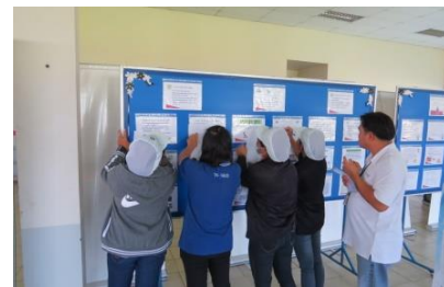
จัดนิทรรศการปลอดภัยและสิ่งแวดล้อมในการทำงาน