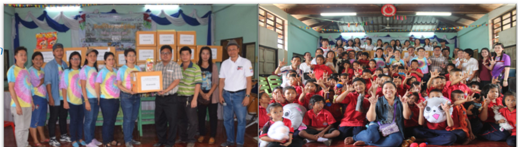
การออกค่ายอาสาทำความดีแก่สังคม ด้วยการบริจาคของใช้จำเป็นให้กับโรงเรียนม่อนกระแตหะ จังหวัดกาญจนบุรี