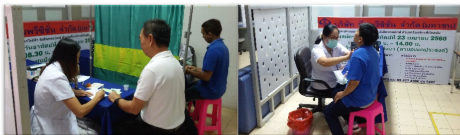
บริการปรึกษาเรื่องสุขภาพ และปัจจัยเสี่ยงในการทำงาน โดยแพทย์เฉพาะทาง