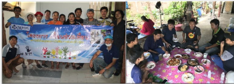
ทำกิจกรรม “เพื่อนช่วยเพื่อน” ร่วมกันเข้าช่วยเหลือปรับปรุงที่อยู่อาศัยของเพื่อนพนักงานที่ขอรับความช่วยเหลือจากบริษัท