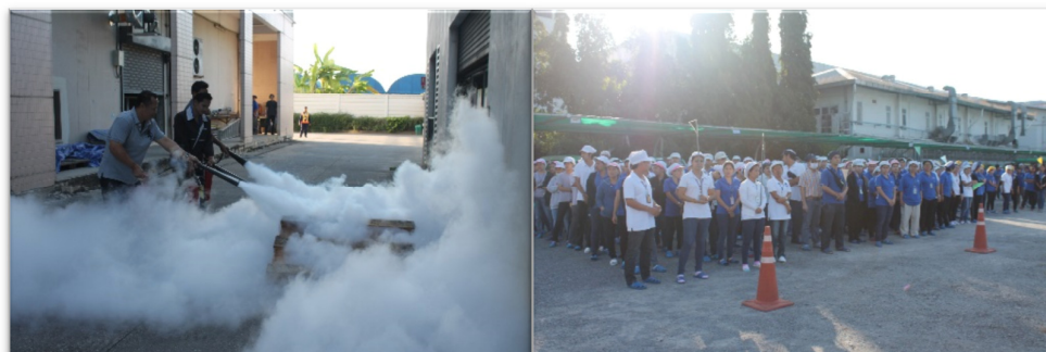
การฝึกอบรมดับเพลิงขั้นต้นและการฝึกซ้อมดับเพลิง