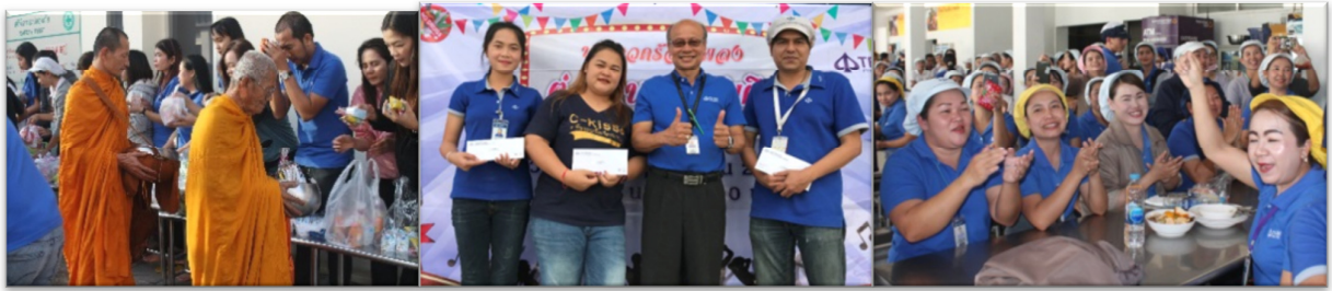
จัดกิจกรรมเพื่อให้พนักงานมีส่วนร่วม และผ่อนคลายจากการทำงาน เช่น การประกวดร้องเพลง เทศกาลปีใหม่