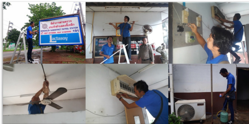
ทำกิจกรรมบำเพ็ญประโยชน์ พัฒนาชุมชนใกล้เคียง เช่น วัด และหน่วยราชการที่ให้บริการกับชุมชน

บริษัท มุ่งเน้นการเสริมสร้างความสัมพันธ์ที่ดีและให้ความช่วยเหลือแก่ชุมชนและสังคม ซึ่งถือเป็นหนึ่งของแผนงาน และกิจกรรมด้านสังคมและสิ่งแวดล้อมที่บริษัท ได้ปฏิบัติมาอย่างสม่ำเสมอ โดยบริษัทได้สนับสนุนชุมชน และโรงเรียน และหน่วยราชการในการที่จะได้ทำกิจกรรมร่วมกัน