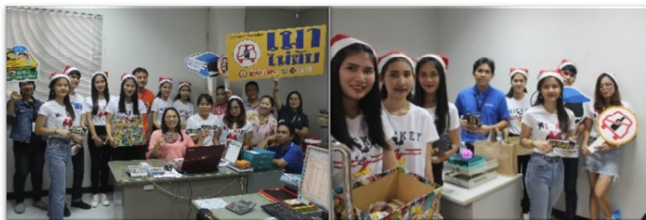
กิจกรรม ประชาสัมพันธ์ วัฒนธรรม ความปลอดภัยในการทำงาน สิ่งแวดล้อมและสุขอนามัยในการทำงาน