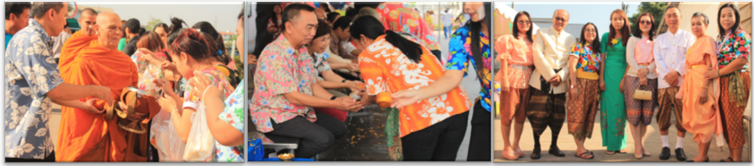
สืบสานวัฒนธรรมประเพณีของไทยตามวาระเทศกาลต่างๆ

การมีส่วนร่วมของพนักงาน บริษัทได้จัดกิจกรรมเพื่อเป็นการส่งเสริมการมีส่วนร่วมของพนักงาน ทั้งทางด้านการบำเพ็ญประโยชน์แก่สังคม กิจกรรมในวาระสำคัญของชาติ งานตามขนบธรรมเนียมประเพณี และโครงการจิตอาสาของพนักงาน