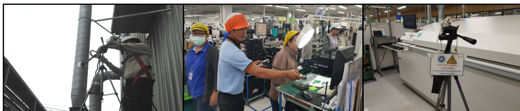
การตรวจวิเคราะห์คุณภาพด้านสิ่งแวดล้อมในสถานประกอบการ

บริษัท ปฏิบัติตามกฎหมายและข้อกำหนดด้านสิ่งแวดล้อมของภาครัฐอย่างเคร่งครัด สม่ำเสมอและต่อเนื่อง โดย การตรวจสอบสภาพแวดล้อมในการทำงาน ทั้งอากาศ ฝุ่นละออง เสียง น้ำ ได้ผ่านเกณฑ์มาตรฐานทั้งหมด ซึ่งไม่ส่งผลกระทบต่อทำลายสิ่งแวดล้อมและทรัพยากรของชุมชน