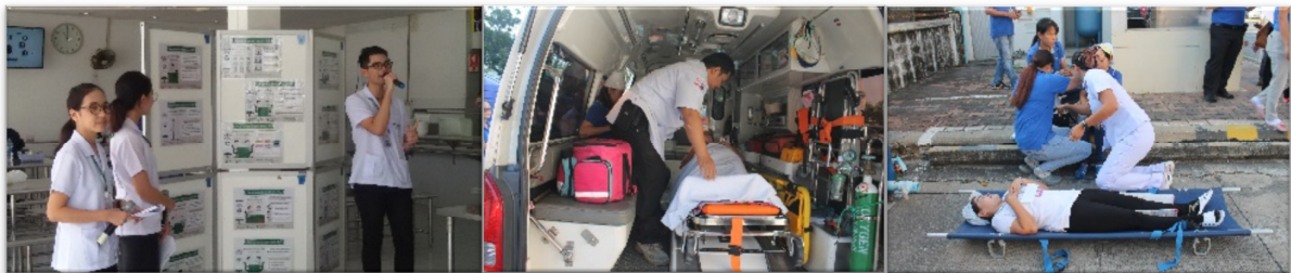
การจัดฝึกอบรมปฐมพยาบาลและปฏิบัติการช่วยชีวิตขั้นพื้นฐาน

บริษัท ยังให้ความสำคัญกับการให้ความรู้กับพนักงานตามความจำเป็นที่พนักงานต้องได้รับการอบรมให้เกิดความเข้าใจ สามารถปฏิบัติและให้ความร่วมมือได้อย่างถูกต้องเมื่อเกิดเหตุฉุกเฉินขึ้น เพื่อหลีกเลี่ยงอันตรายและการสูญเสีย บาดเจ็บ