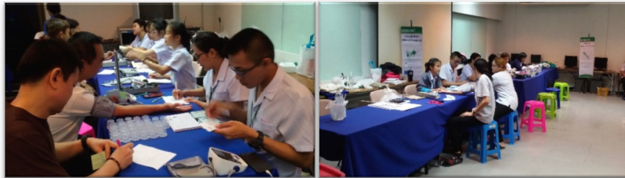
การตรวจสุขภาพทั่วไป ป้ายเสี่ยงประจำปีของพนักงานต่อเนื่องทุกปี

ด้านสวัสดิการ การรักษาพยาบาลและความปลอดภัย ถือเป็นความรับผิดชอบต่อของบริษัท ที่จะต้องดูแลสวัสดิภาพของพนักงาน และรักษาสภาพการทำงานให้เป็นไปโดยถูกต้อง ปลอดภัย และถูกสุขลักษณะ และยึดมั่นในการปฏิบัติตามกฎหมายที่เกี่ยวข้องกับแรงงานอย่างเคร่งครัด พร้อมทั้งคำนึงถึงสวัสดิภาพที่ดีของพนักงานเป็นสำคัญ