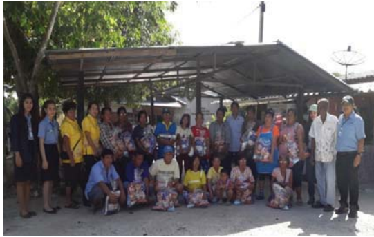
แจกถุงยังชีพให้ชาวบ้าน