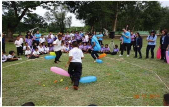
ร่วมจัดการแข่งขันกีฬาโรงเรียน