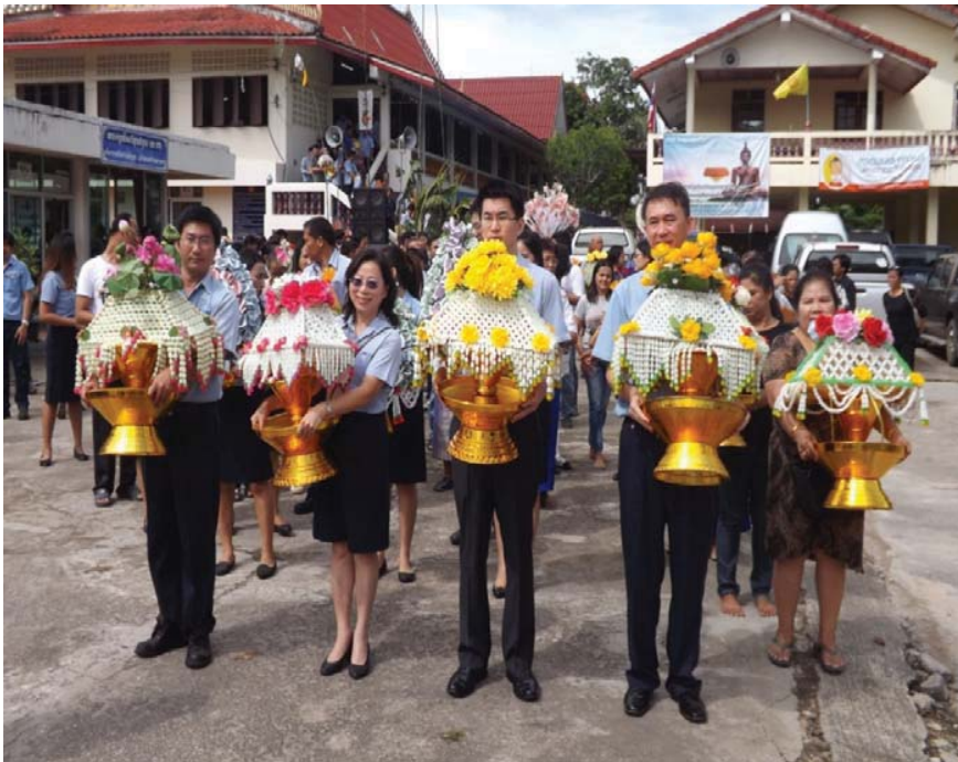
ทอดกฐินสามัคคีวัดชาวกัมพูดา