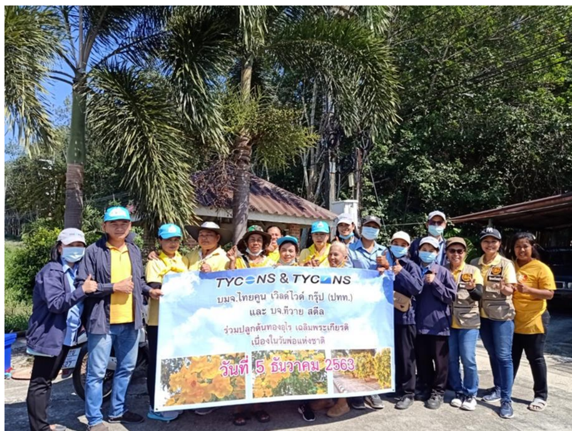
ร่วมกิจกรรมทำบุญวันพ้อแห่งชาติและปลูกต้นทองอุไรเฉลิมพระเกียรติ