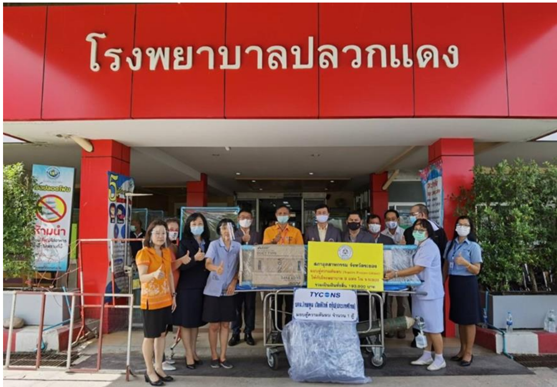
มอบเงินร่วมจัดทำตู้ความดันลบ