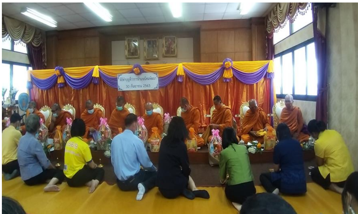
ทำบุญเลี้ยงพระ