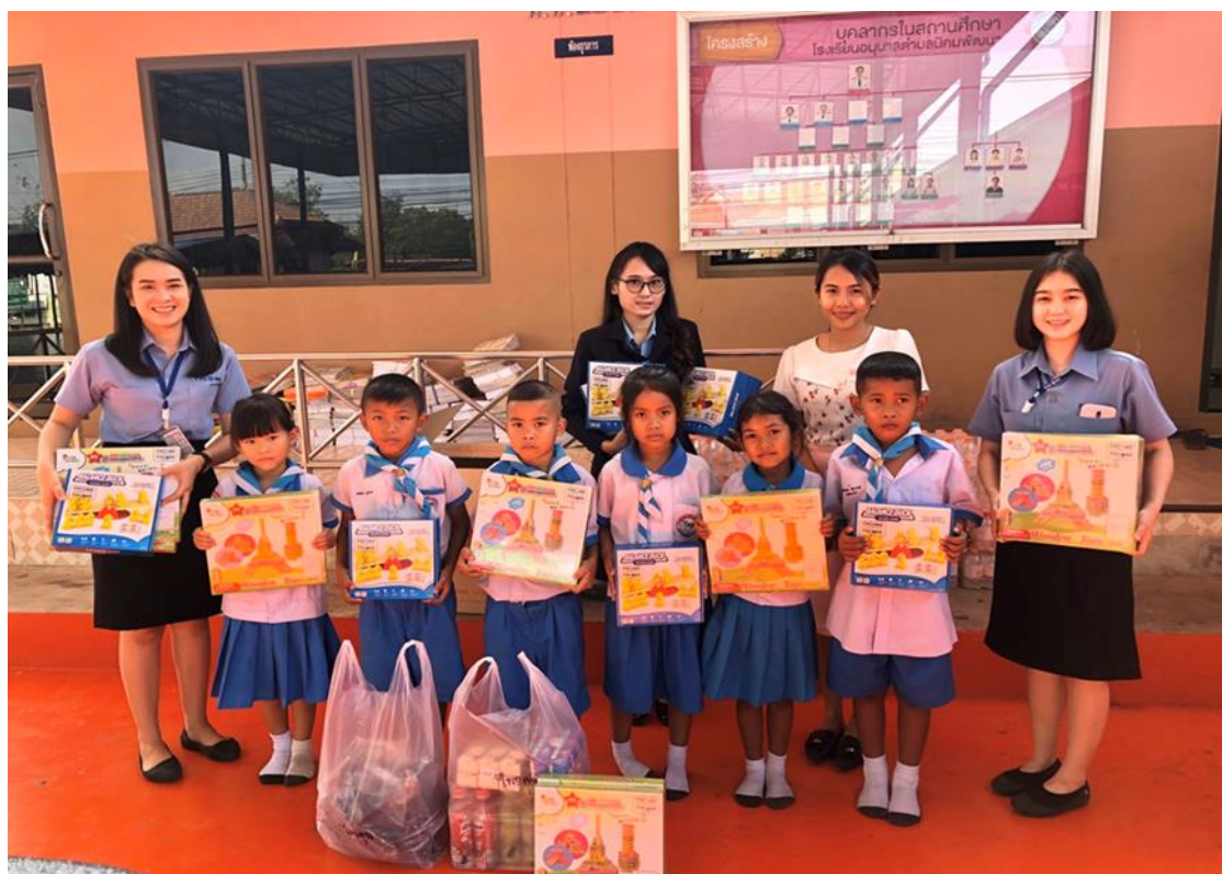
มอบอุปกรณ์การเรียน ของขวัญ และขนมเพื่อสนับสนุนการจัดกิจกรรมวันเด็กแห่งชาติ