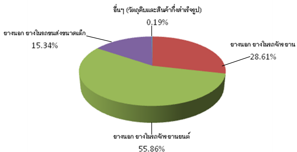
สัดส่วนยอดขายสินค้าปี 2555