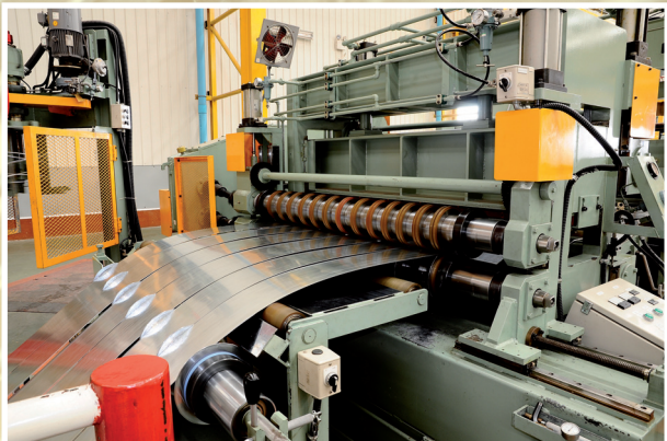
งานสลิตเหล็ก/งานตัดเหล็ก