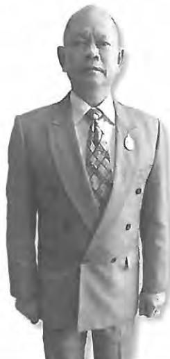
พลเอกนาวิน คำธิกาญจน์