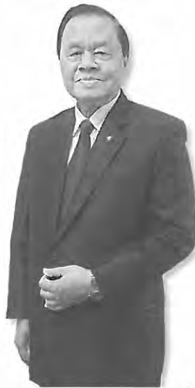
พลเอกวิชิต ยาทิพย์