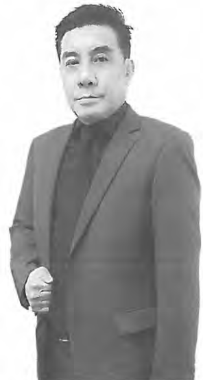
พลโทอนุมนตร์ วัฒนศิริ