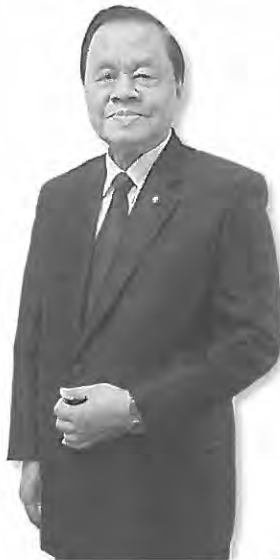
พลเอกวิชิต ยาทิพย์