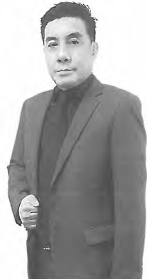
พลโทอนุมนตร์ วัฒนศิริ