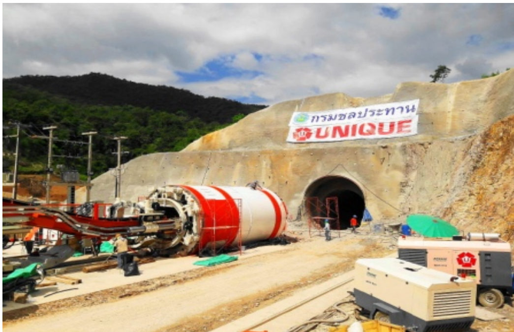
โครงการถนนวงแหวนอุตสาหกรรม สัญญาที่ 3