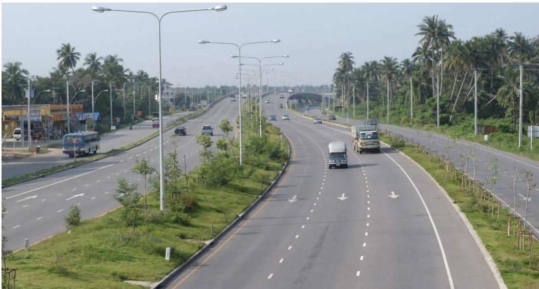
โครงการถนนจตุรทิศ - ตะวันออก (ช่วง ก.)

โครงการก่อสร้างถนนวัดนครอินทร์และเชื่อมต่อถนนติวานนท์ – ถนนเพชรเกษม – ถนนรัตนวิเบศร์ สัญญาที่ เอ็มเอส 3 : งานก่อสร้างถนนเหนือใต้ ระหว่างกิโลเมตรที่ 0+000 – กิโลเมตรที่ 6+300 (ถนนวัดนครอินทร์)