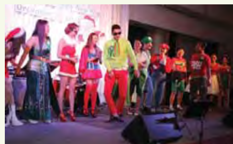
PHOL New Year Party