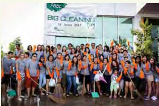
Big Cleaning Day 2014