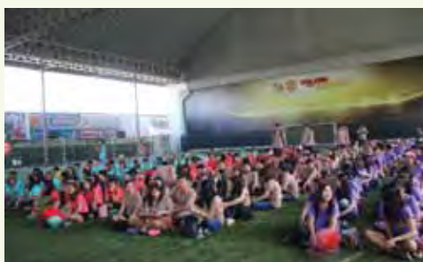
PHOL Sport Day 2014

บริษัทส่งเสริมให้พนักงานมีความรัก ความสามัคคี มีวัฒนธรรมองค์กรที่ดี มีความสุขในการทำงาน สร้างโอกาสให้พนักงานได้มีส่วนร่วมในการดำเนินกิจกรรมที่เป็นประโยชน์ต่อชุมชน สังคม สิ่งแวดล้อม ปลุกจิตสำนึกในการเป็นจิตอาสาให้กับพนักงาน บริษัทสนับสนุนให้จัดกิจกรรมสัมพันธ์ประจำปีในหลากหลายรูปแบบ โดยใช้หลักการสร้างความสุข 8 ประการ(Happy 8) เป็นแนวทางในการจัดกิจกรรมในด้านต่างๆ เพื่อส่งเสริมพนักงานและองค์กรให้เป็นองค์กรแห่งความสุข (Happy Workplace) กิจกรรมที่จัดเป็นประจำทุกปี ได้แก่ กิจกรรมงานเลี้ยงสังสรรค์ปีใหม่ กิจกรรมรดน้ำคำหัวขอพรผู้ใหญ่ในวันสงกรานต์ กิจกรรมท่องเที่ยวประจำปี กิจกรรมชมรมกีฬาและสันทนาการ กิจกรรมทำบุญบริษัทประจำปี และกิจกรรมร่วมทำบุญในวันสำคัญทางศาสนา เป็นต้น