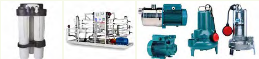
เครื่องกรองน้ำสำหรับครัวเรือน