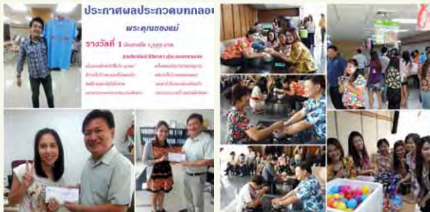
กิจกรรมวันแม่