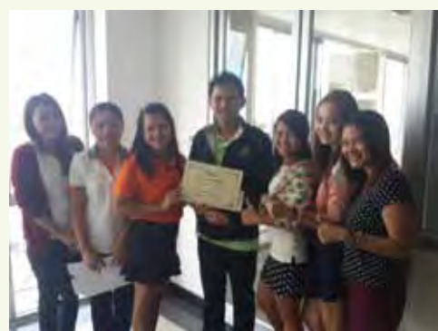
รางวัล 5ส ดีเด่น