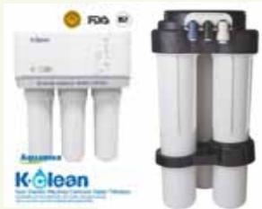
เครื่องกรองน้ำสำหรับครัวเรือน