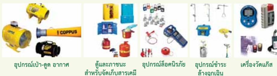
อุปกรณ์เป่า-ดูด อากาศ