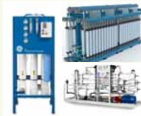
ระบบบำบัดน้ำสำหรับอุตสาหกรรม