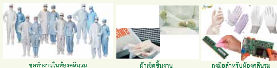
ชุดทำงานในห้องคลีนรูม