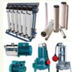
อุปกรณ์สำหรับระบบบำบัดน้ำ

3.2 การให้บริการจำหน่ายน้ำจากระบบบำบัดให้แก่ลูกค้า ในลักษณะเดียวกับรูปแบบของสัมปทาน (Build-Own-Operate) โดยดำเนินการตั้งแต่การออกแบบ ผลิตและติดตั้งระบบ และนำระบบไปติดตั้งในสถานที่ของลูกค้าในลักษณะพร้อมใช้งาน และเก็บเกี่ยวรายได้จากการจำหน่ายน้ำที่บำบัดได้ให้กับลูกค้าตามระยะเวลาที่ระบุในสัญญา โดยที่บริษัทเป็นเจ้าของกรรมสิทธิ์ระบบดังกล่าว