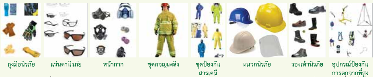
ถุงมือนิรภัย

1.1 อุปกรณ์นิรภัยส่วนบุคคล (Personal Protective Equipment - PPE) เป็นอุปกรณ์ที่บุคคลหรือผู้ปฏิบัติงานใช้สวมใส่บนอวัยวะส่วนใดส่วนหนึ่งของร่างกายหรือหลายส่วนร่วมกันในขณะทำงาน เพื่อป้องกันอันตรายที่อาจเกิดขึ้นจากสภาวะแวดล้อมในการทำงาน เช่น อันตรายจากความร้อน, แสง, เสียง, สารพิษ, สารเคมี เป็นต้น โดยสินค้าในหมวดอุปกรณ์นิรภัยส่วนบุคคลนี้ สามารถแบ่งเป็นอุปกรณ์ที่ใช้ปกป้องร่างกายตั้งแต่ศีรษะจรดเท้า เช่น หมวกนิรภัย, แว่นตานิรภัย, ที่อุดหู, หน้ากากป้องกันฝุ่นและสารเคมี, ถุงมือนิรภัย, รองเท้านิรภัย, ชุดผจญเพลิง และอุปกรณ์ป้องกันภัยอื่นๆ เป็นต้น