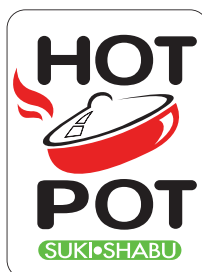
สอท พอท สุกี้ ชาบู