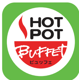
สอท พอท อินเตอร์ บุฟเฟต์

ในปี 2559 บริษัทได้เปิดให้บริการร้านอาหารทั้งหมด 5 แบรนด์ ดังนี้