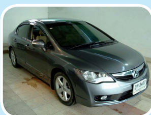
รถยนต์นั่งส่วนบุคคล