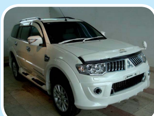
รถยนต์เพื่อการพาณิชย์