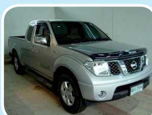
รถยนต์เอนกประสงค์