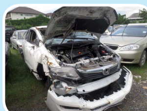
ซากรถยนต์