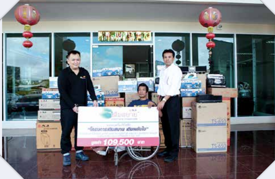
การบริจาคเครื่องใช้ไฟฟ้าให้กับผู้พิการ