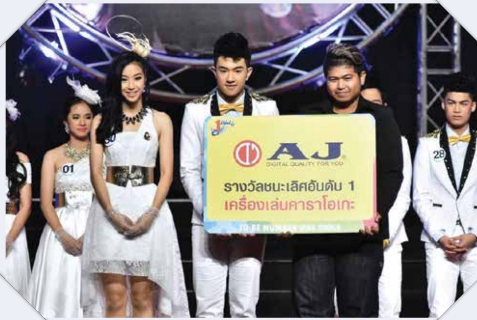
การมอบทุนให้กับโครงการภูมิคุ้มกันเบอร์วัน