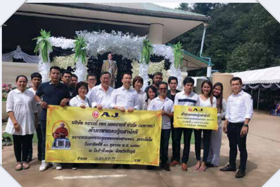
การถวายกฐินให้แก่วัดห้วยบึงกุ่ม จังหวัดชัยภูมิ เพื่อสร้างโรงพยาบาลน้ำพอง จังหวัดขอนแก่น