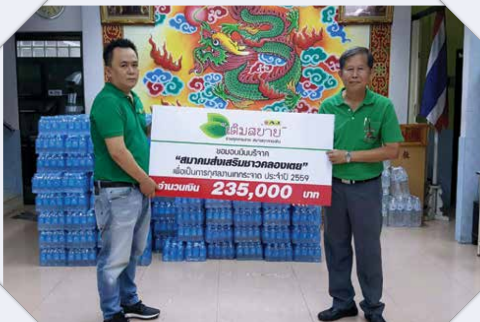
การบริจาคเงินเพื่อเป็นการกุศลงานเทศกาล ไท่แก่ สมาคมส่งเสริมชาวคลองเตย