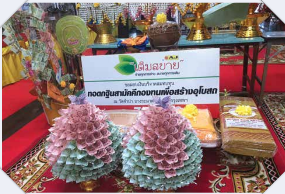
การถวายกฐินให้แก่วัดจำปา จังหวัดกรุงเทพมหานคร เพื่อสร้างอุโบสถ