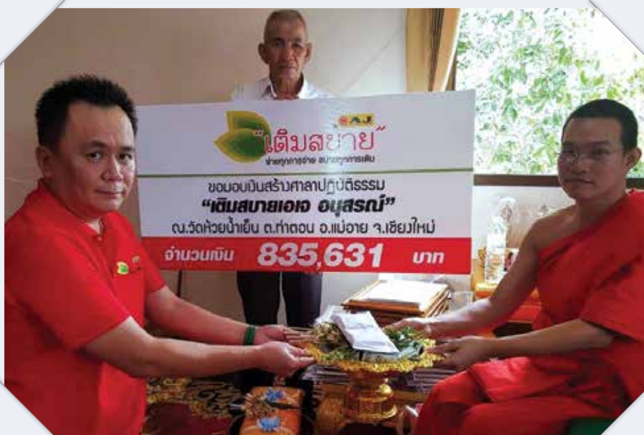
การบริจาคเงินเพื่อสร้างศาลาปฏิบัติธรรม ณ วัดห้วยน้ำเย็น จ.เชียงใหม่