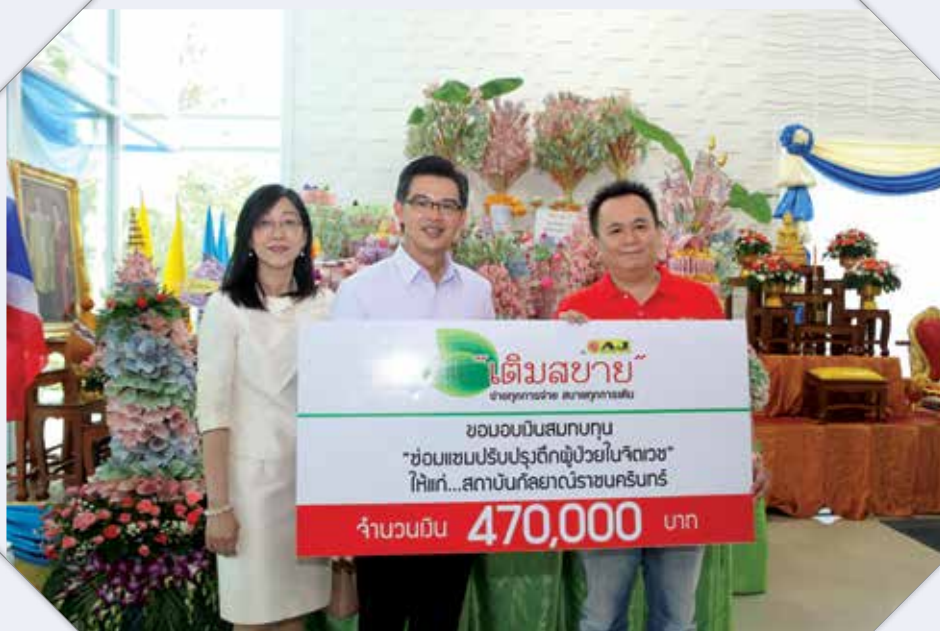
โครงการซ่อมแซมปรับปรุงตึกผู้ป่วยจิตเวช ไค้เก๋ สถาบันกัลยาณิราชนครินทร์