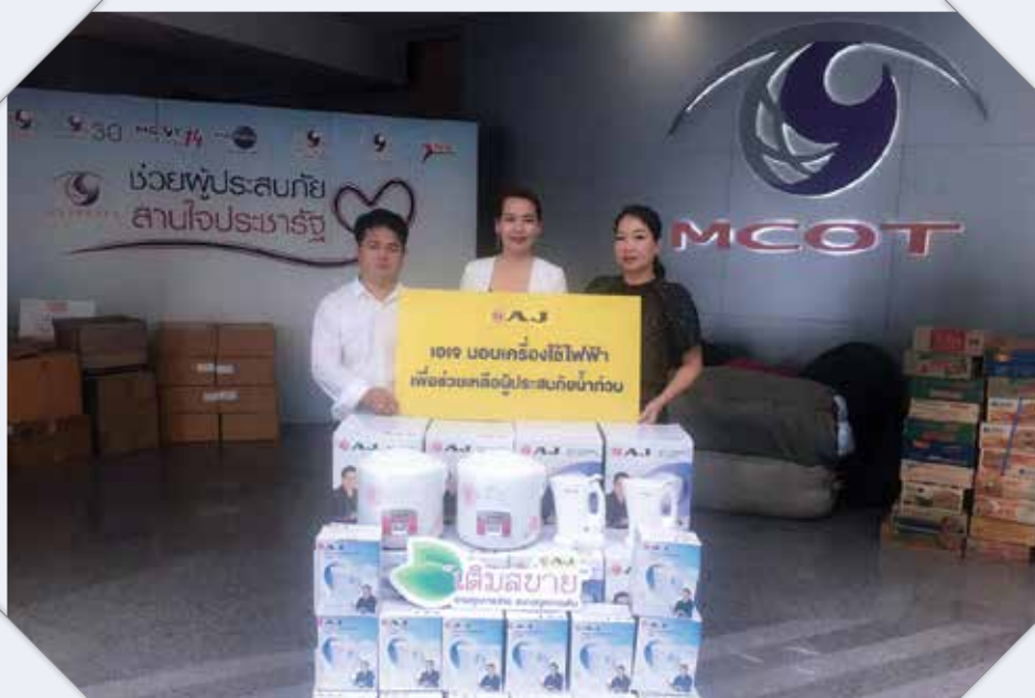
การบริจาคเครื่องใช้ไฟฟ้าเพื่อช่วยเหลือผู้ประสบภัยน้ำท่วม