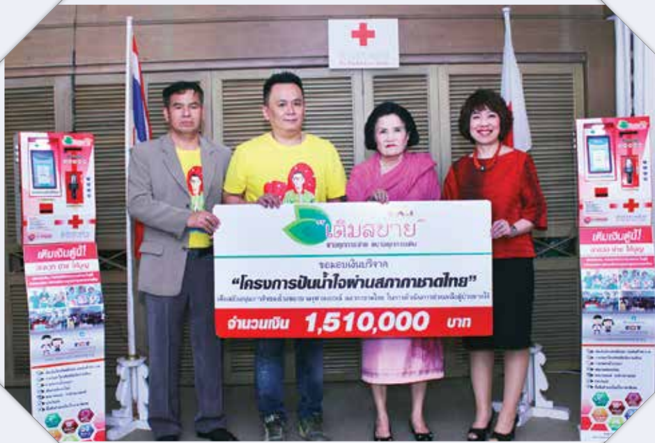
โครงการปันน้ำใจผ่านสภาชาดไทยเพื่อสนับสนุนภารกิจ ของโรงพยาบาลจุฬาลงกรณ์ สภากาชาดไทย ในการดำเนินการช่วยเหลือผู้ป่วยยากไร้