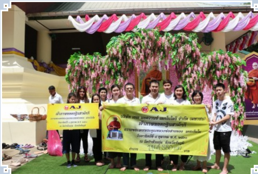
ร่วมเป็นเจ้าภาพงานทอดกฐินสามัคคี ณ วัดป่าห้วยกุ่ม ถวายหลวงพ่อดำทอญ เทศะรัมย์