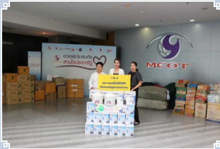
มอบเครื่องใช้ไฟฟ้าช่วยเหลือผู้ประสบภัยภาคใต้