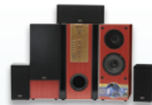
ไมโครคอมโพเนนท์