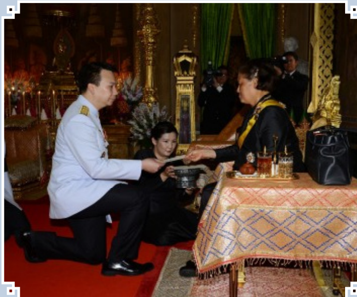
ถวายผ้าพระกฐิน ณ วัดราชาธิวาสวิหาร