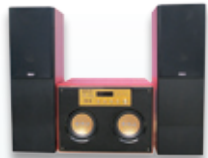
ชุดโฮมเธียเตอร์

ตัวอย่างสินค้าเครื่องใช้ไฟฟ้าในกลุ่มเครื่องเสียง