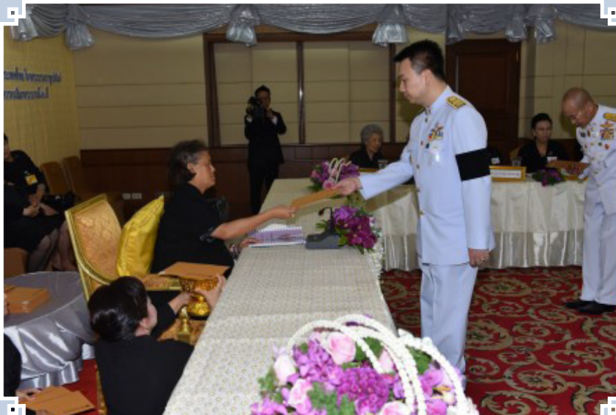
ถวายเงินให้แก่มูลนิธิหัวใจแห่งประเทศไทย ในพระบรมราชูปถัมภ์