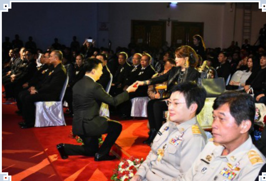
สนับสนุนโครงการ To Be No.1 Idols รุ่นที่ 7