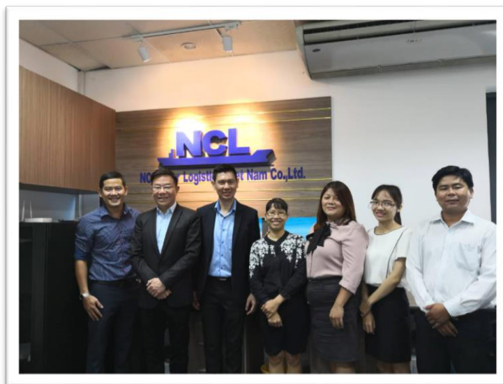
คณะผู้บริหาร NCL เข้าตรวจเยี่ยมสำนักงาน NCL Inter Logistics Viet Nam Co.,Ltd. ประเทศเวียดนาม ระหว่างวันที่ 17-18 กันยายน 2561