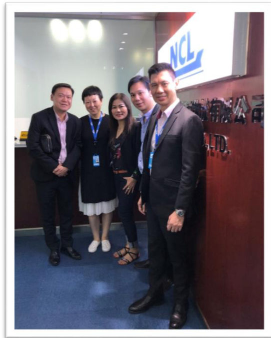
คณะผู้บริหาร NCL ตรวจเยี่ยมสำนักงาน Qingdao NCL Co., Ltd. ประเทศจีน ระหว่างวันที่ 11 - 13 กันยายน 2561