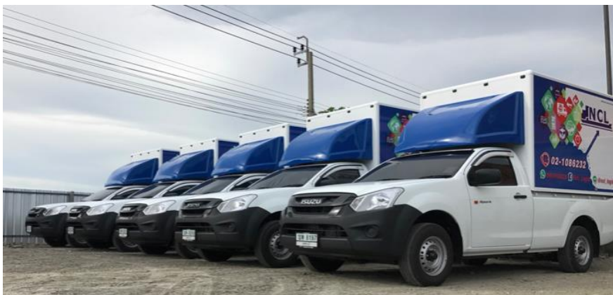
ตัวอย่างภาพรถกระบะพิกอัป

การขนส่งในประเทศของกลุ่มบริษัทฯ นอกจากจะมีการขนส่งโดยรถหั่วลากและหางพ่วงภายใต้การดำเนินงานของบริษัท SSK แล้ว ในปี 2560 บริษัทฯ ได้เริ่มลงทุนในกิจการขนส่งโดยรถกระบะพิกอัป เพื่อใช้รับขนส่งกระจายสินค้าต่าง ๆ เพื่อเป็นการขยายขอบเขตการให้บริการแก่กลุ่มลูกค้าที่ต้องการเคลื่อนย้ายสินค้าในประเทศทางถนนด้วยรถกระบะพิกอัป โดยอาศัยความชำนาญด้านการบริการจัดการระบบการขนส่งสินค้า ของบริษัท ฯ และสามารถสนับสนุนการขยายธุรกิจทางด้านการขนส่งสินค้าของบริษัทฯ ให้เติบโตได้ โดย ปัจจุบันมีการให้บริการขนส่งทั้งระยะใกล้และระยะไกล