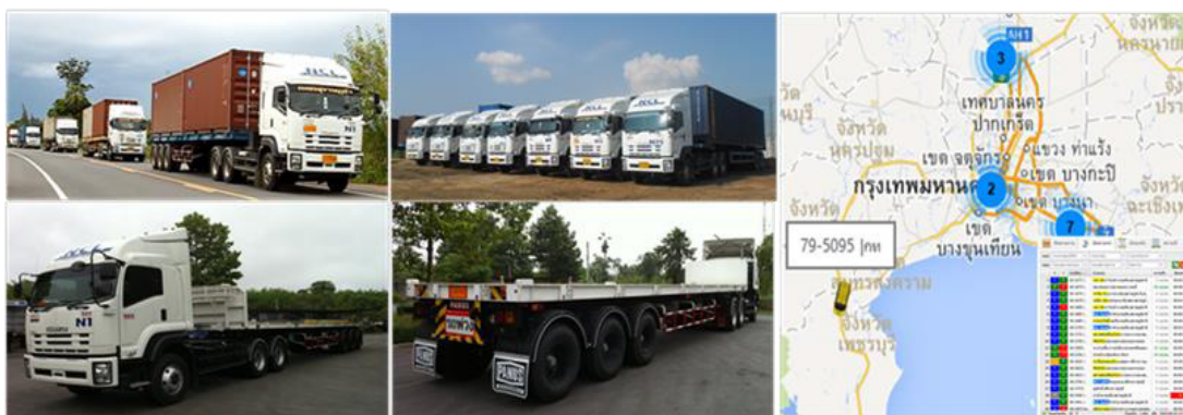
ตัวอย่างภาพรถบรรทุกหัวลาก-หางลาก