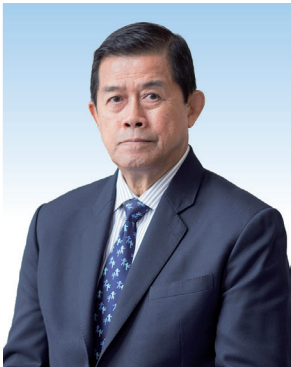
(นายกร ทัพพะรังสี) ประธานกรรมการ