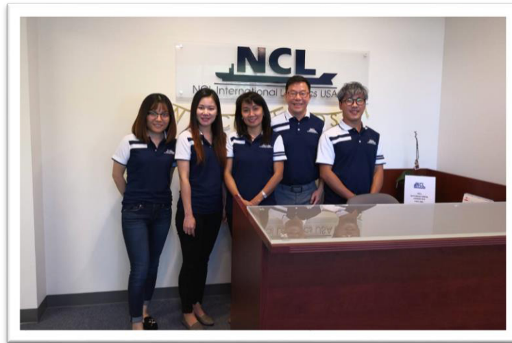
คณะผู้บริหาร NCL เข้าตรวจเยี่ยมสำนักงาน NCL International Logistics USA Inc. ประเทศสหรัฐอเมริกา เมื่อวันที่ 1 ตุลาคม 2561 ที่ผ่านมา