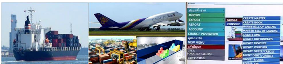
ตัวอย่างภาพการขนส่งระหว่างประเทศและการจัดตู้คอนเทนเนอร์

1.1.3 บริการอื่น ๆ : บริษัทฯ มีการให้บริการด้านพิธีการศุลกากรและเอกสารต่าง ๆ ที่เกี่ยวข้อง ตลอดจนการเป็นตัวแทนในการออกสินค้าให้แก่ลูกค้า ซึ่งการดำเนินการดังกล่าวต้องอาศัยผู้ที่มีความเชี่ยวชาญด้านพิธีการศุลกากรและกฎระเบียบเกี่ยวกับการนำเข้า-ส่งออก เพื่อให้ลูกค้าสามารถปฏิบัติตามข้อกำหนดที่เกี่ยวข้องในแต่ละประเทศได้อย่างถูกต้องและสามารถรับหรือส่งสินค้าไปยังจุดหมายปลายทางได้ตรงตามกำหนดเวลา