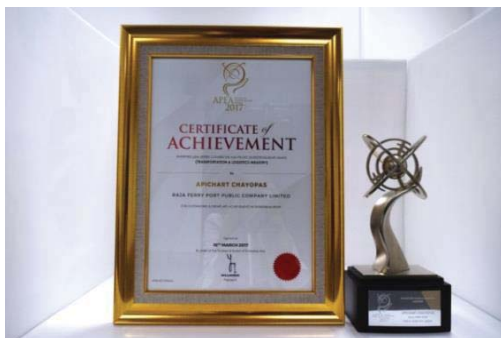
รางวัล Asia Pacific Entrepreneurship Awards2017(APEA 2017)