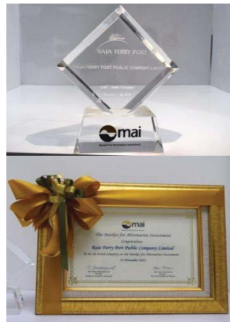
รางวัลThe Market of Alternative Investment