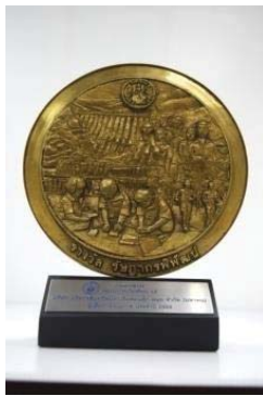
รางวัลรัฐภาารพิพัฒน์

บริษัทให้ความสำคัญในการมุ่งเน้นปฏิบัติตามหลักการกำกับดูแลกิจการที่ดีในทุกส่วนงานและทุกกระบวนการทำงานทั้งองค์กร ซึ่งตั้งบนหลักพื้นฐานของความถูกต้อง โปร่งใส ยุติธรรม ตรวจสอบได้ นอกจากนี้ พันธกิจของบริษัทที่วางไว้ “มุ่งมั่นพัฒนาคุณภาพการบริหารจัดการแบบบูรณาการ” เพื่อให้สามารถตอบสนองต่อความต้องการของลูกค้าได้อย่างครอบคลุมสะท้อนให้เห็นถึงความยึดมั่นในหลักการกำกับดูแลกิจการที่ดีและมีความรับผิดชอบต่อสังคม ซึ่งบริษัทเร่งสร้างมาตรฐานการกำกับดูแลกิจการที่ดีอย่างต่อเนื่องโดยบริษัทยังได้รับรางวัลต่างๆ นับเป็นความสำเร็จและความภาคภูมิใจในการขับเคลื่อนองค์กรให้เติบโตได้อย่างยั่งยืนต่อไปในอนาคต