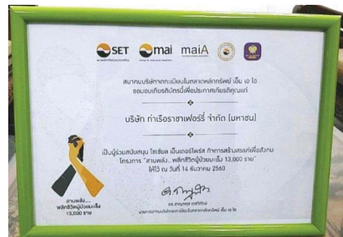
รางวัล Social Enterprise