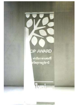
รางวัล IPOP Award