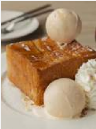
ชีนุ่ยฯ อันนีโทส