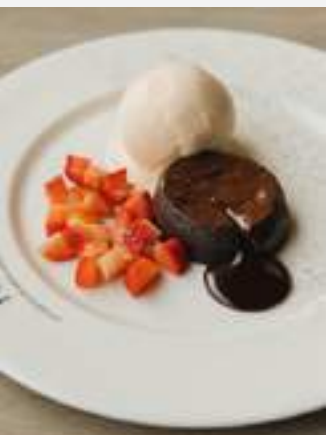
ช็อคโกแลตลาวา