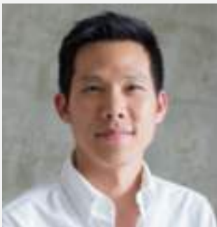
นายแม่ทัพ ต.สุวรรณ กรรมการ และ กรรมการผู้จัดการ