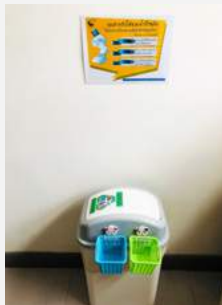
รับบริจาคขวดน้ำพลาสติกที่ใช้แล้วทั้ง เพื่อนำไปทอเป็นผ้าไตร หรือผ้าบังสุกุล จีวร ร่วมกับวัดจากแดง