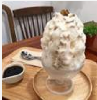
Mont Blanc Chestnut