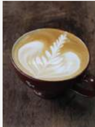
ลาเต้ร้อน