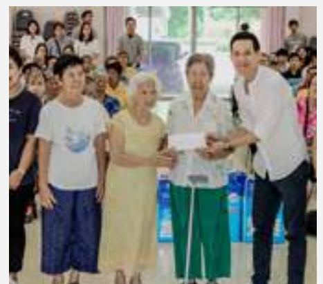
กิจกรรมเลี้ยงอาหารกลางวันและขนมแก่ผู้สูงอายุที่ศูนย์พัฒนาการจัดสวัสดิการสังคมผู้สูงอายุบ้านบางแค