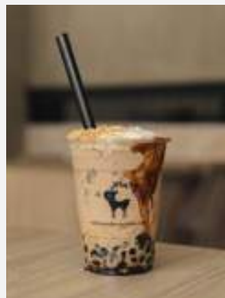
โบบา คาราเมล ครีม ที