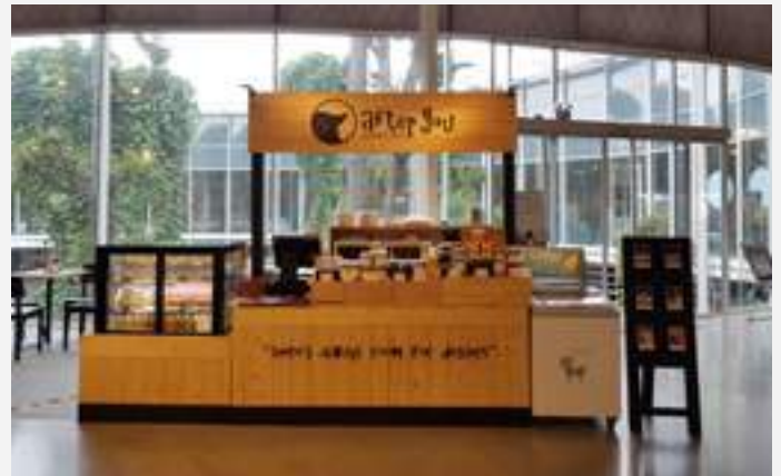
การขายนอกสถานที่