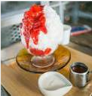
Ichigo and Yogurt

ในปี 2558 เมื่อน้ำแข็งไส คากิโกริ ที่ให้บริการในร้าน อาฟเตอร์ ยู ได้รับความนิยมและผลตอบรับที่ดีจากผู้บริโภคเป็นอย่างมาก จนได้รับการบรรจุเป็นเมนูหลักของร้าน ในปี 2559 บริษัทฯ ได้เห็นโอกาสทางธุรกิจในการขยายฐานผู้บริโภค บริษัทฯ จึงได้ขยายสายผลิตภัณฑ์สู่ร้านน้ำแข็งไสภายใต้ชื่อ “ เมโกริ “ ซึ่งร้านน้ำแข็งไสนี้มีแนวทางการตกแต่งร้านที่ให้บรรยากาศแบบสบายเป็นกันเอง ทำให้ผู้บริโภครู้สึกผ่อนคลายเหมือนอยู่บ้าน ด้วยแนวคิดของร้านน้ำแข็งไสที่เป็นของหวานคู่กับเขตเมืองร้อนของประเทศไทย กลุ่มผู้บริโภคจึงมีความหลากหลายไม่ใช่เพียงแค่กลุ่ม นักเรียน นักศึกษา คนทำงาน เท่านั้น แต่ครอบคลุมไปถึงกลุ่มแม่บ้าน ไปจนถึงผู้สูงอายุ ซึ่งมีผลิตภัณฑ์เป็นน้ำแข็งไสหลากหลายเมนูที่ถูกเลือกสรรพิเศษ อาทิ Ichigo and yogurt, Mont Blanc Chestnut, Hojicha, Ume เป็นต้น