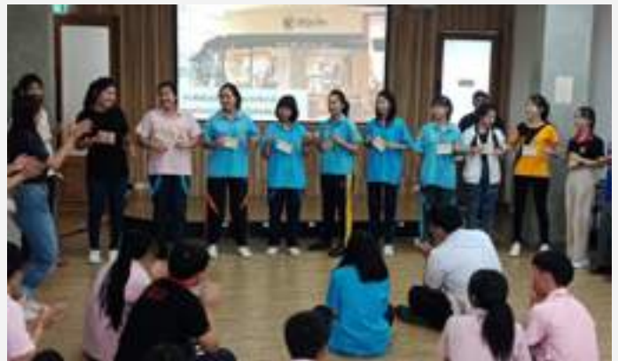
เข้าร่วมโครงการการศึกษาระบบทวิภาคี