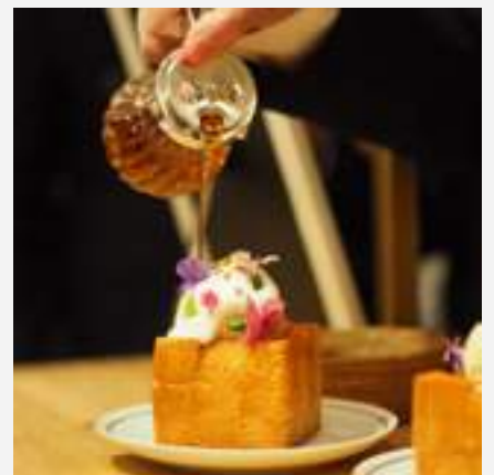
การบริการจัดงานนอกสถานที่