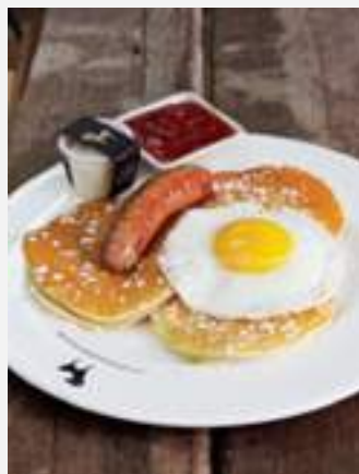
แพนเค้กไส้กรอกไข่ดาว