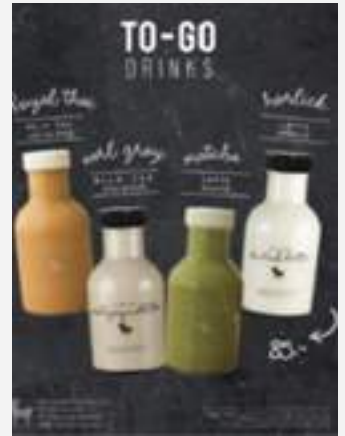
เครื่องดื่มบรรจุขวด