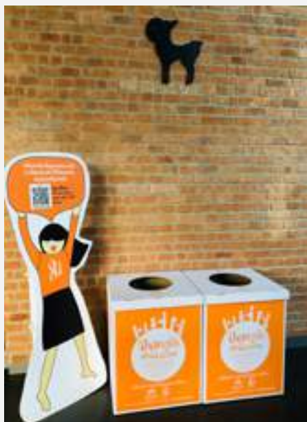
รับบริจาคสิ่งของเพื่อนำไปจำหน่ายในร้าน ปันกันเพื่อนำรายได้เป็นทุนการศึกษาให้ เด็กในมูลนิธิยุวพัฒน์