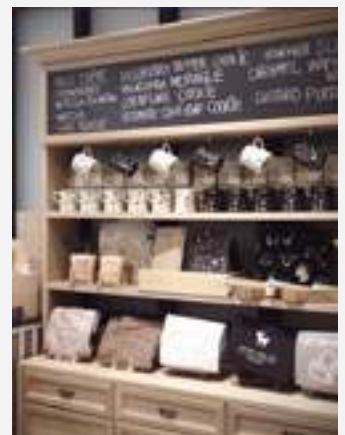
ของที่ระลึก