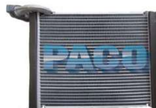
สำหรับรถยนต์ยี่ห้อ TOYOTA รุ่น Altis ปี 2006 – 2019, รุ่น Vigo ปี 2004 – 2015 รุ่น Innova ปี 2004 – 2015 และรุ่น HiAce Commuter (ส่วนหน้า) 2004 - 2019