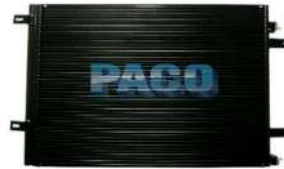
สำหรับรถยนต์ยี่ห้อ Ford รุ่น F-Series Super Duty ปี 2007-2019