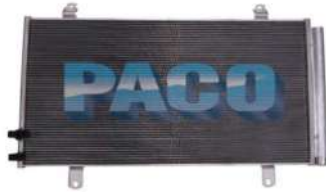
สำหรับรถยนต์ยี่ห้อ TOYOTA รุ่น Camry ปี 2006-2013