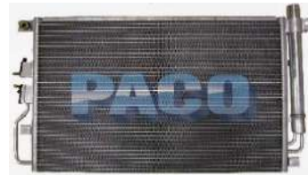
สำหรับรถยนต์ยี่ห้อ GMC รุ่น Terrain และ Chevrolet รุ่น Equinox ปี 2011