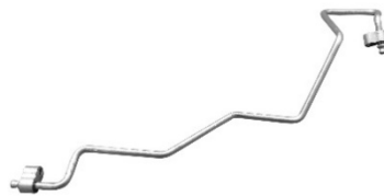
สำหรับรถยนต์ยี่ห้อ Mitsubishi รุ่น Lancer GLXi ปี 1996 - 1998