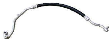
สำหรับรถยนต์ยี่ห้อ Nissan รุ่น Teana ปี 2009 - 2011