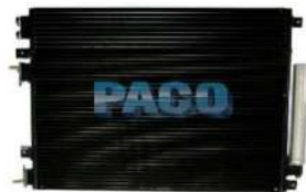
สำหรับรถยนต์ยี่ห้อ Dodge รุ่น Challenger ปี 2009