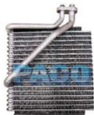
สำหรับรถยนต์ยี่ห้อ ISUZU รุ่น D-Max ปี 2002-2012