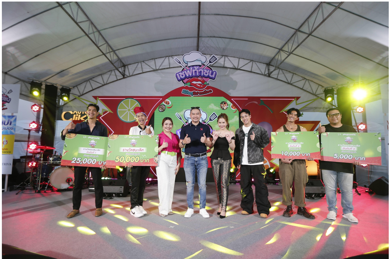
เชฟทำขนม