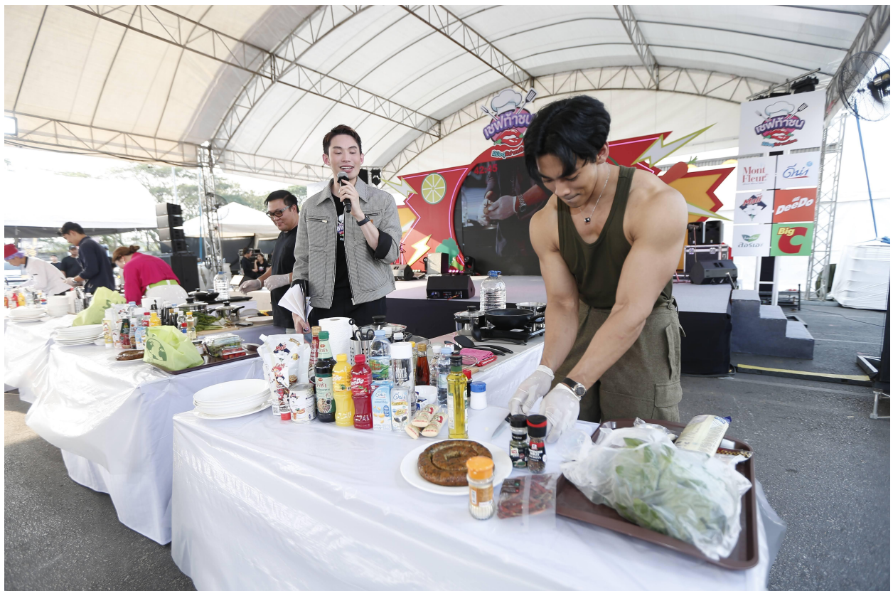
เชฟทำขนม