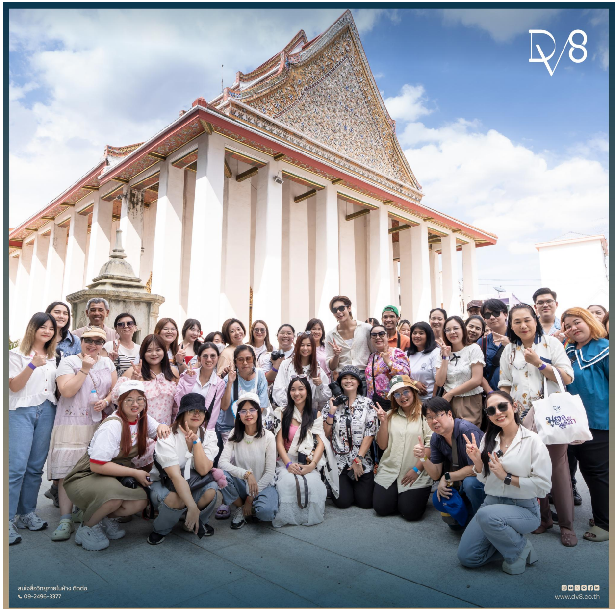
มุเตลู มุเตรัก