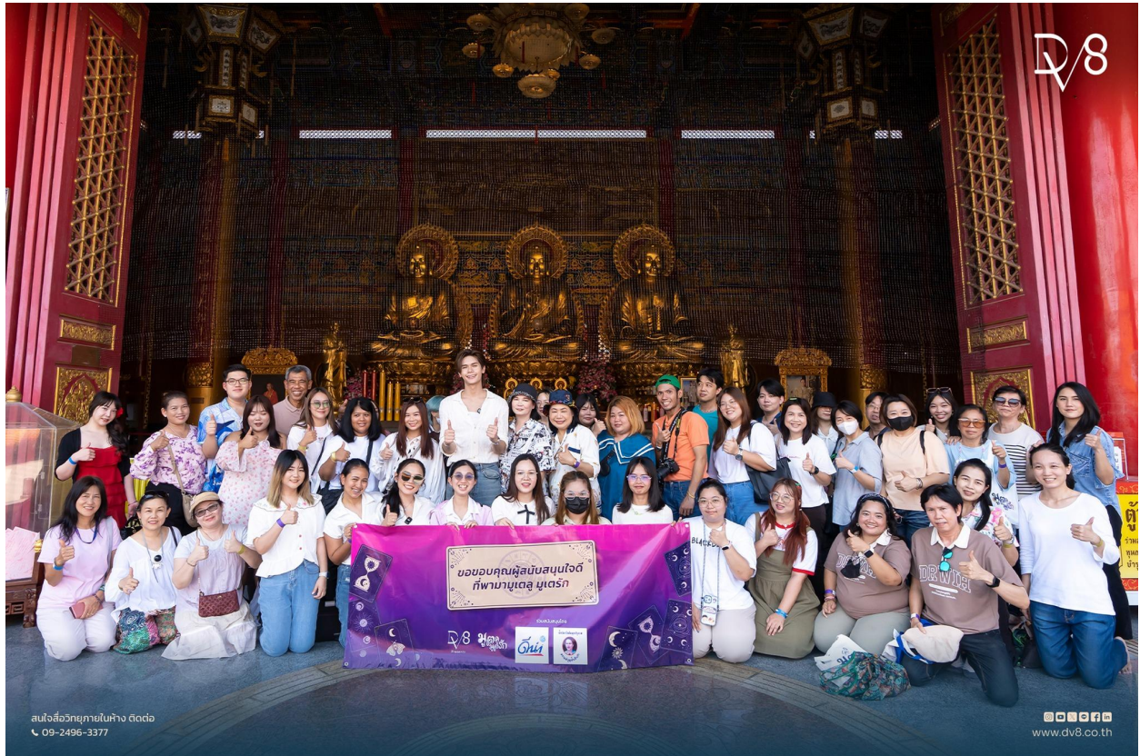
มูเตกรู มูเตกรัก