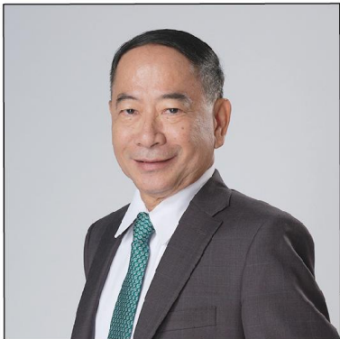
พลอากาศเอก พงศธร บัวกรทรัพย์