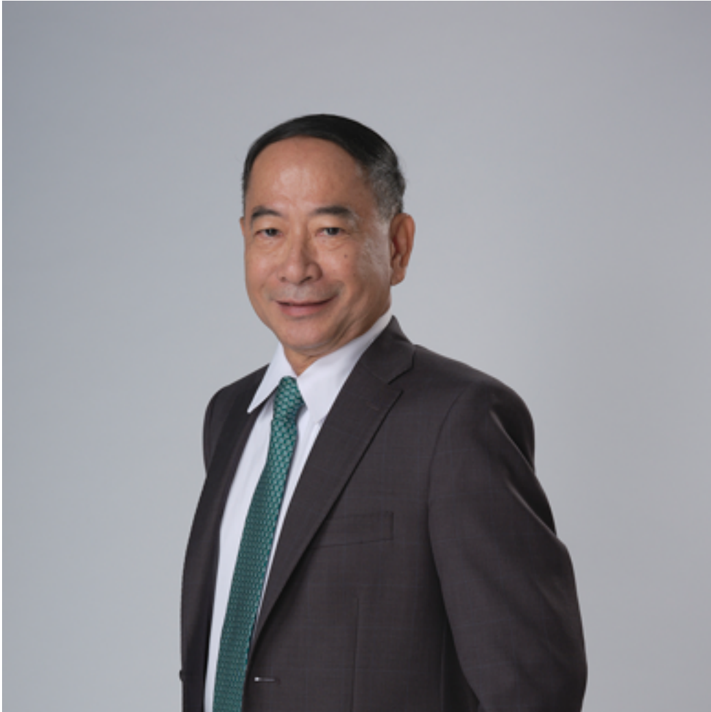
ประธานกรรมการบริษัท