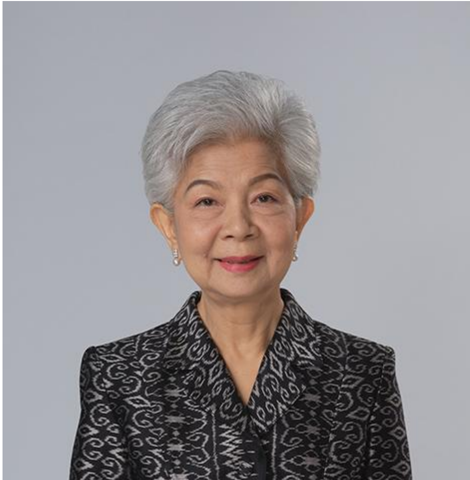
ประธานกรรมการบริษัท