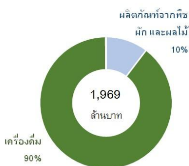
โครงสร้างของรายได้จากขายสำหรับปี 2568

เครื่องดื่ม (การดำเนินงานต่อเนื่อง) ประกอบด้วย ธุรกิจน้ำผลไม้และน้ำผักพร้อมดื่ม และ ธุรกิจน้ำแร่ธรรมชาติบรรจุขวด ผลิตภัณฑ์จากพืช ผัก และผลไม้ (การดำเนินงานต่อเนื่อง) ประกอบด้วย ผลิตภัณฑ์จากพืช ผัก และผลไม้ ผลิตภัณฑ์เพื่อสุขภาพ และการเกษตร รายได้ส่วนงานที่ยกเลิก (ไม่ได้รวมอยู่ในแผนภาพนี้) เกิดจากธุรกิจลับแปรรูป มูลค่า 6 ล้านบาท