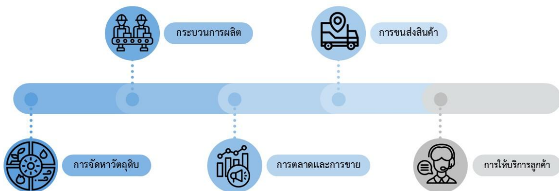
ห่วงโซ่คุณค่าธุรกิจ