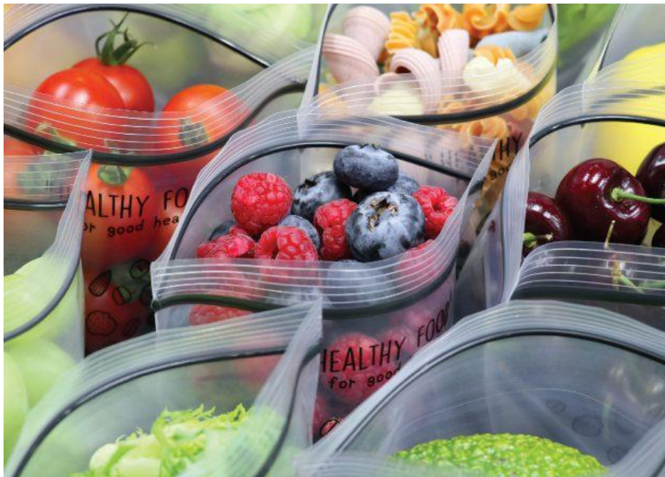
ถุงซิปปามาตรฐาน