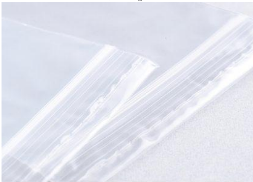
ถุงซิปปาพร้อมซิลปากถุง