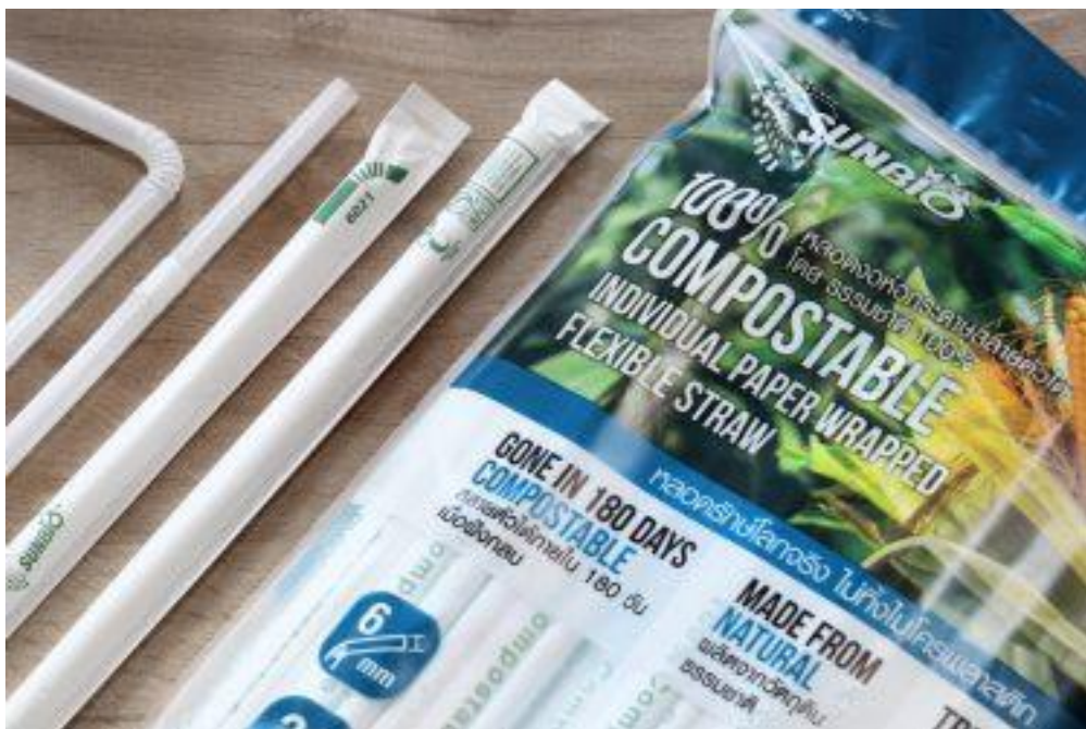
หลอดดูดเครื่องดื่ม