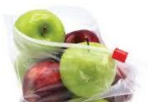
ถุงซิปล็อคเดอร์

นโยบายการวิจัยและพัฒนาในด้านต่าง ๆ และรายละเอียดเกี่ยวกับการพัฒนานวัตกรรมในกระบวนการ สินค้าและ/หรือบริการ หรือโมเดลธุรกิจ