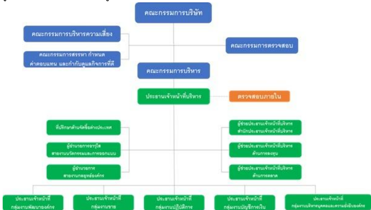
โครงสร้างการกำกับดูแลกิจการ