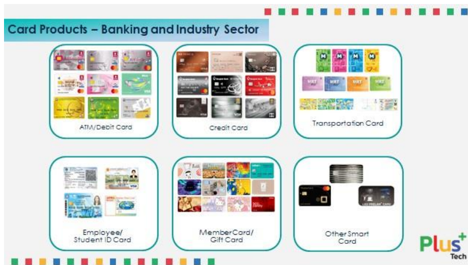
ตัวอย่างบัตรพลาสติก