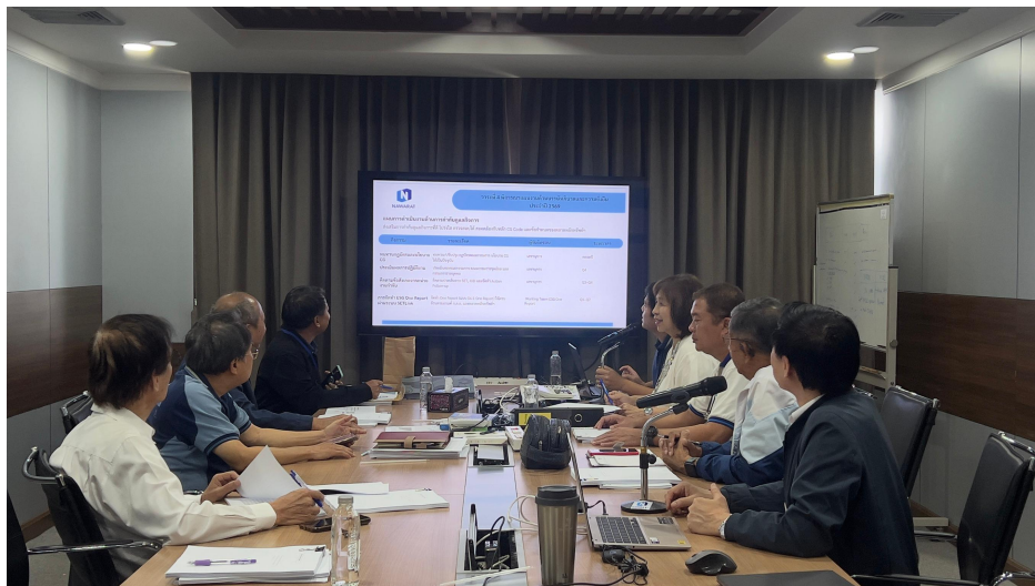
ทบทวนจรรยาบรรณธุรกิจ