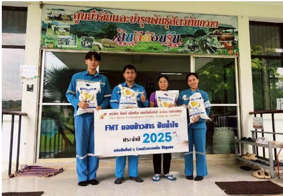
สนับสนุนข่าวสารให้ชุมชนรอบโรงงาน หมู่ที่ 4