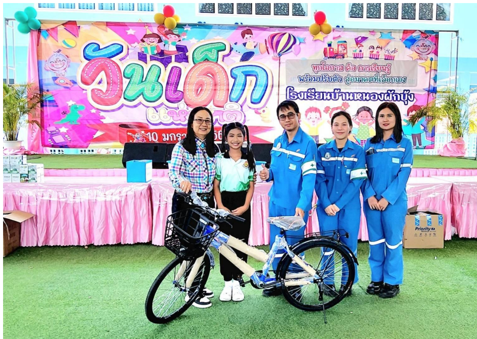
สนับสนุนกิจกรรมวันเด็กให้โรงเรียนรอบโรงงาน