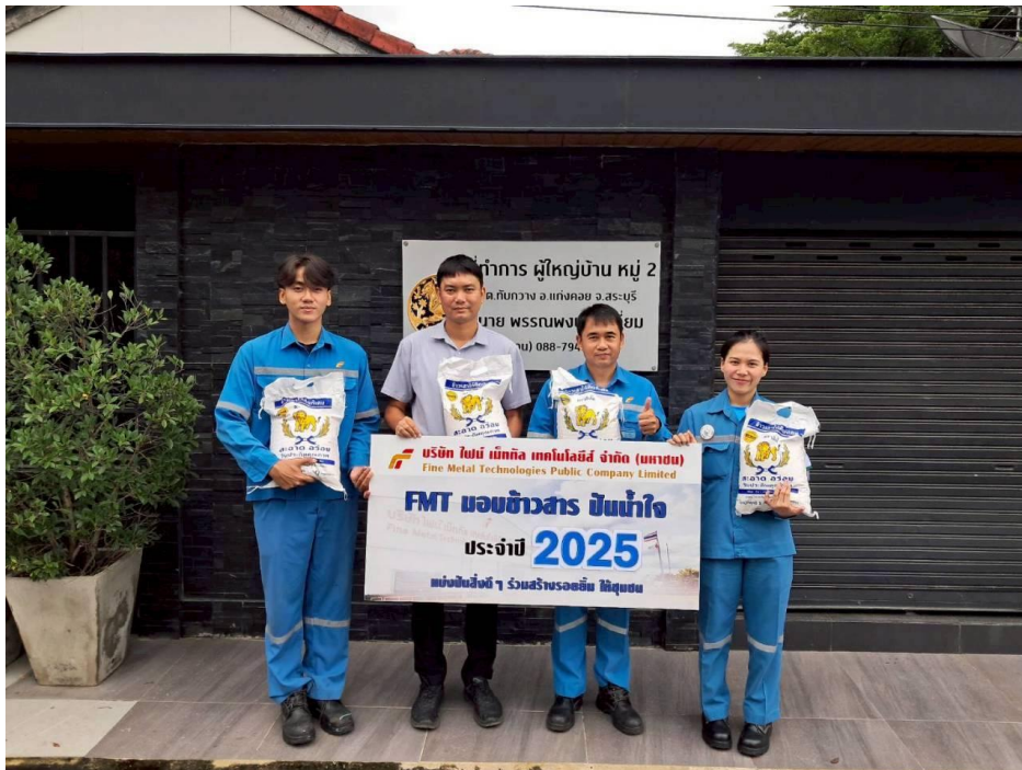
สนับสนุนข้าวสารให้ชุมชนรอบโรงงาน หมู่ที่ 2