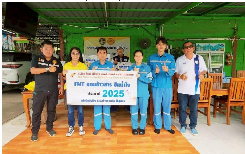
สนับสนุนข่าวสารให้ชุมชนรอบโรงงาน หมู่ที่ 6