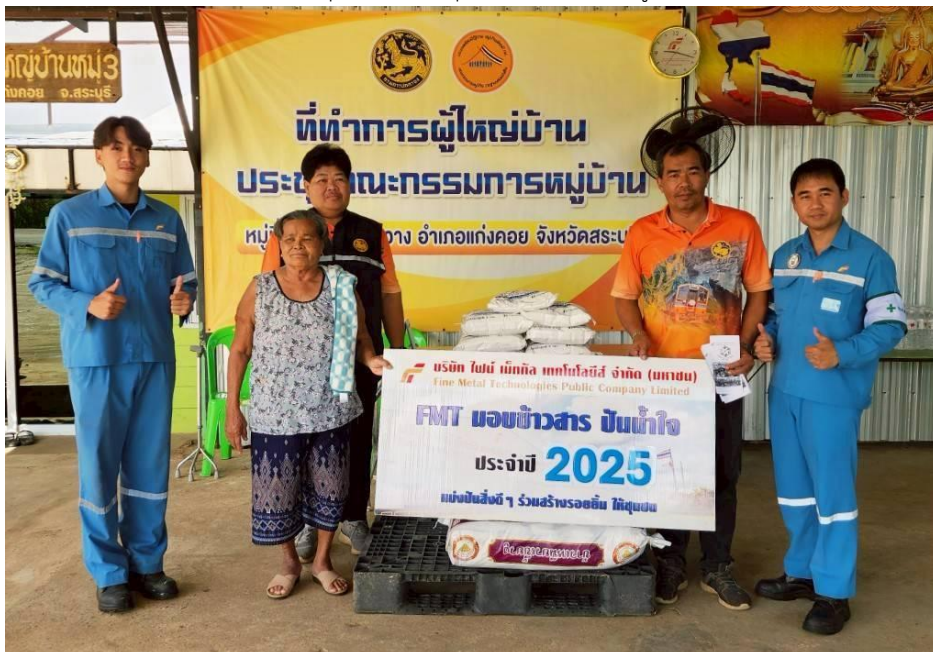
สนับสนุนข้าวสารให้ชุมชนรอบโรงงาน หมู่ที่ 3