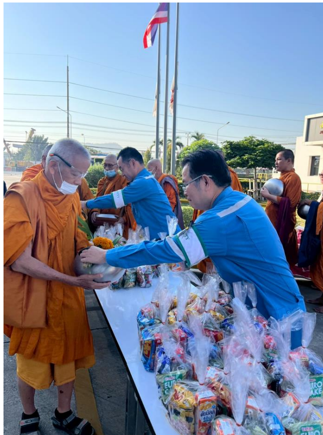
กิจกรรมตักบาตรข้าวสารอาหารแห้ง