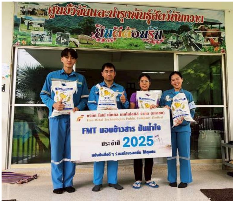
สนับสนุนข้าวสารให้ชุมชนรอบโรงงาน หมู่ที่ 4