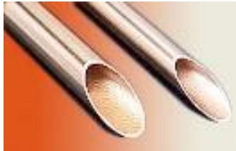
Multi Grooved Tube

Multi Grooved Tube ท่อทองแดงแบบไร้ตะเข็บที่มีผิวด้านนอกเรียบ และมีร่องตัดอยู่ที่ผิวด้านใน ร่องดังกล่าวช่วยเพิ่มพื้นที่ผิวด้านใน ทำให้ประสิทธิภาพการถ่ายเทความร้อนดีขึ้นอย่างมาก เมื่อเปรียบเทียบกับข้อกำหนดด้านประสิทธิภาพของท่อผิวเรียบ สามารถลดปริมาณการใช้ท่อทองแดง ในกระบวนการผลิตเครื่องแลกเปลี่ยนความร้อนได้ ดังนั้นจึงถูกนำมาใช้ในการผลิตเครื่องปรับอากาศขนาดกะทัดรัดที่มีประสิทธิภาพสูง.