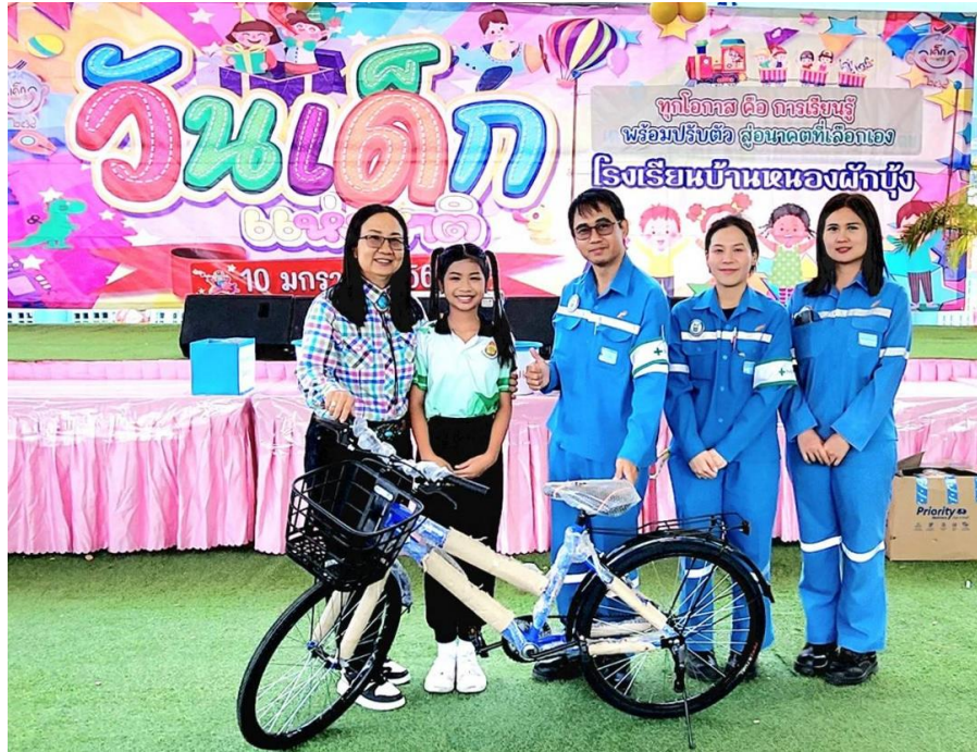
สนับสนุนกิจกรรมวันเด็กให้โรงเรียนรอบโรงงาน