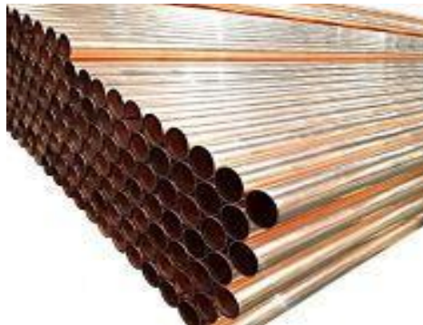
Large Diameter Tube

Large Diameter Tube เป็นท่อทองแดงแบบไร้ตะเข็บชนิดตรงที่มีเส้นผ่านศูนย์กลางขนาดใหญ่ ซึ่งโดยทั่วไปใช้สำหรับการผลิตถังสะสมสารทำความเย็น