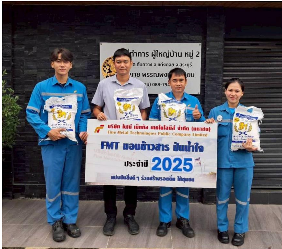
สนับสนุนข้าวสารให้ชุมชนรอบโรงงาน หมู่ที่ 2

รูปภาพผลการดำเนินงานและผลลัพธ์ด้านการจัดการพนักงานและแรงงาน