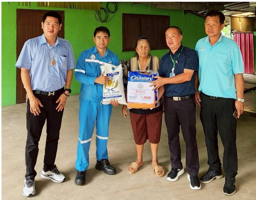
สนับสนุนข้าวสารให้ชุมชนรอบโรงงาน หมู่ที่ 6