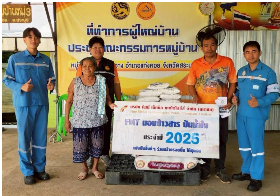
สนับสนุนข้าวสารให้ชุมชนรอบโรงงาน หมู่ที่ 3