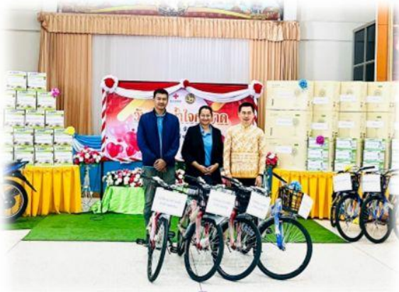
สนับสนุนการจัดงานกาชาดจังหวัดปี 2568 ร่วมกับทำ การปกครองอำเภอบางกล่ำ จ. สงขลา