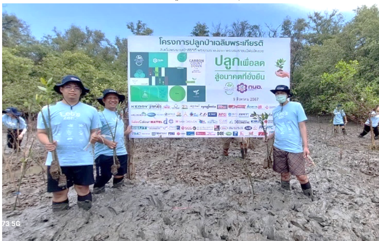
กิจกรรมปลูกป่าชายเลนภายใต้โครงการ "Let's Zero TOGETHER"