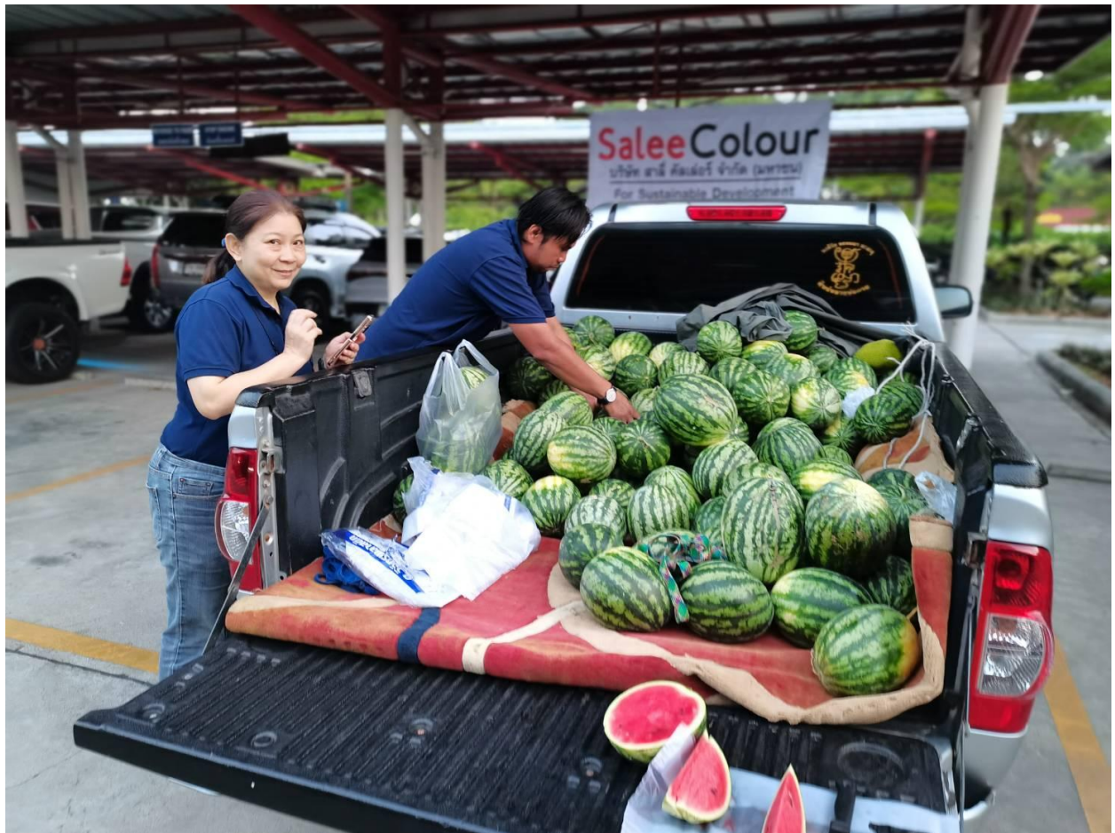
โครงการสนับสนุนผลไม้ในฤดูกาลจากเกษตรกรชาวสวน