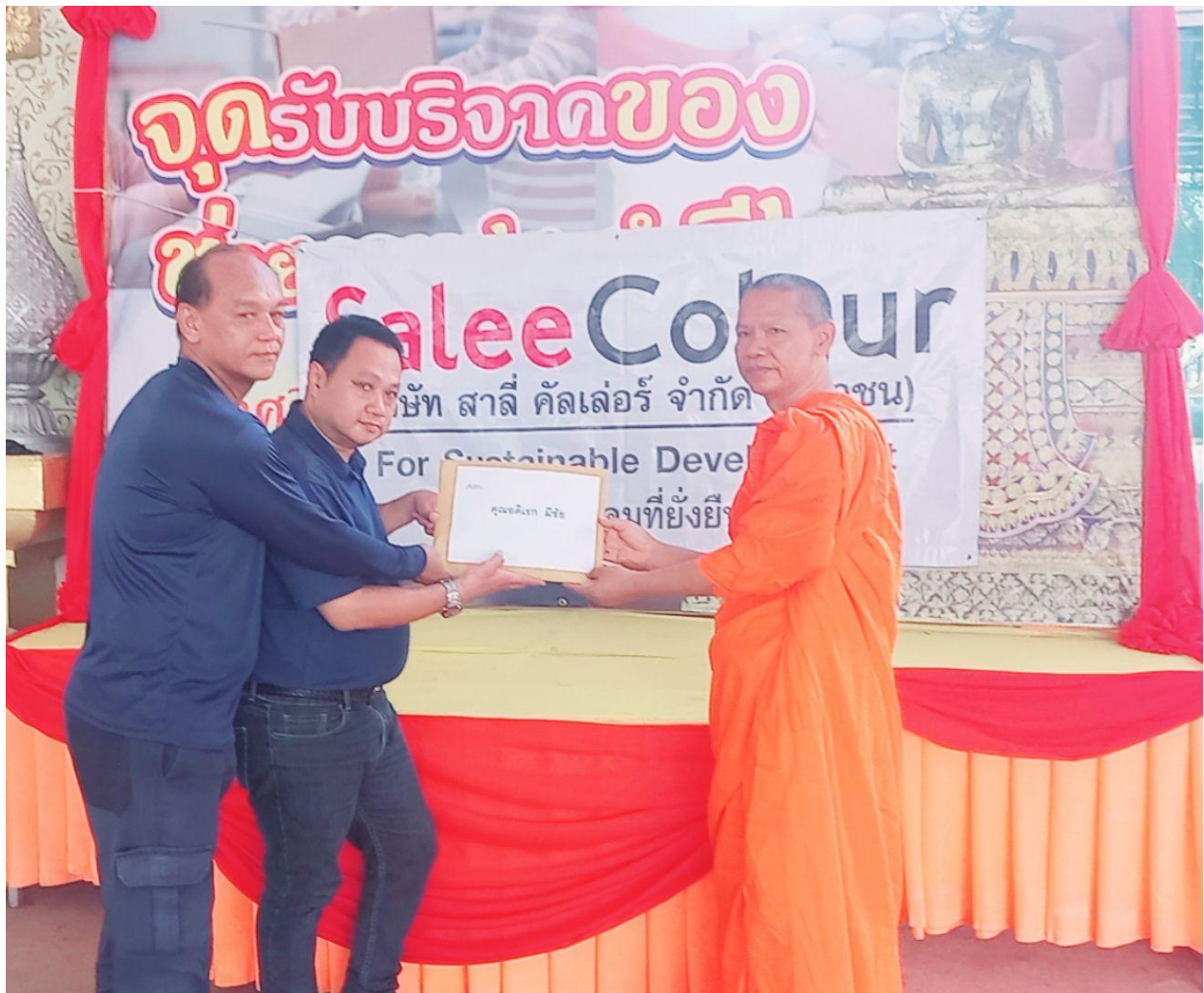
มอบเงินทำบุญให้กับ วัดศรีจันทร์ จ.สมุทรปราการ