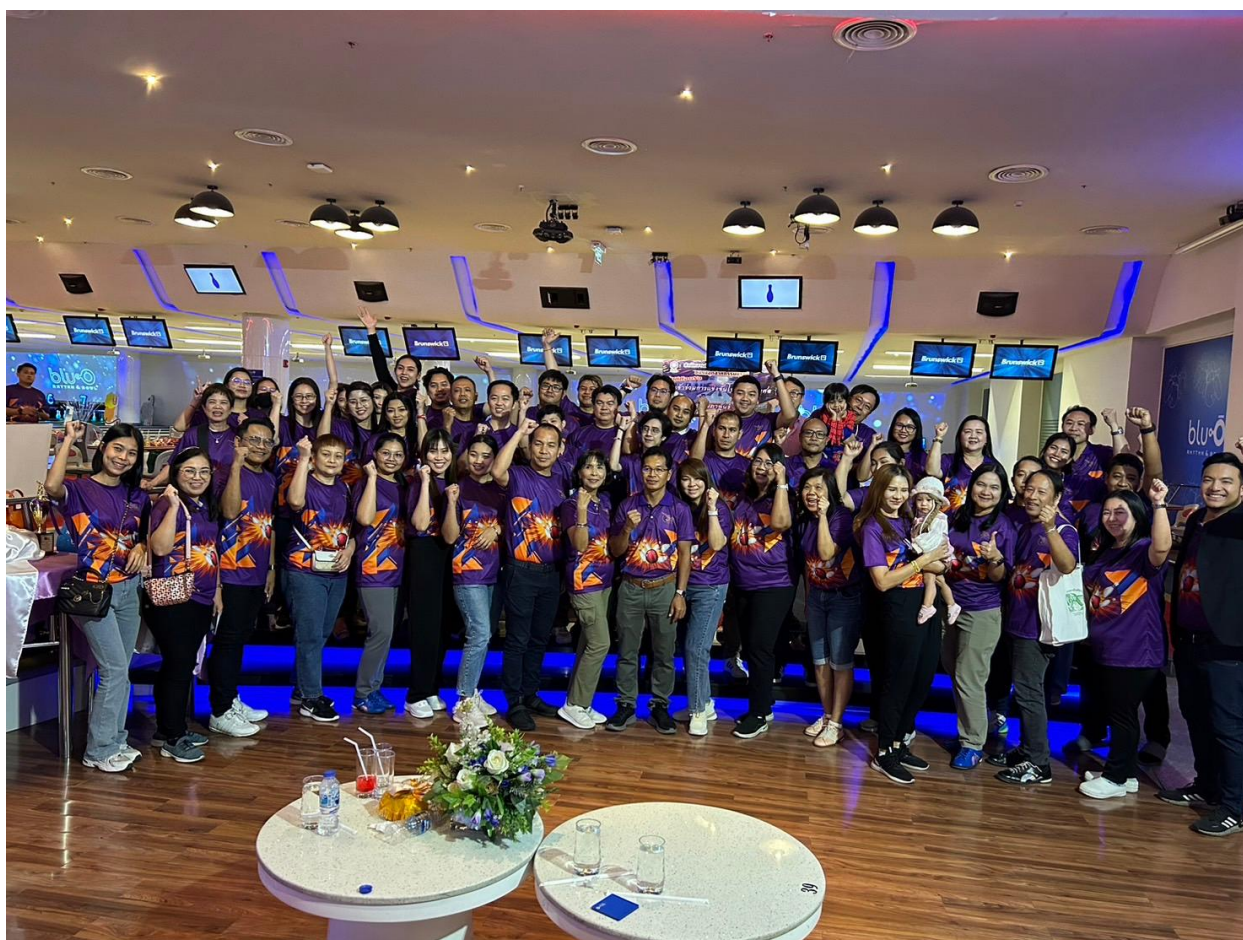
การแข่งขันโบว์ลิ่งการกุศล