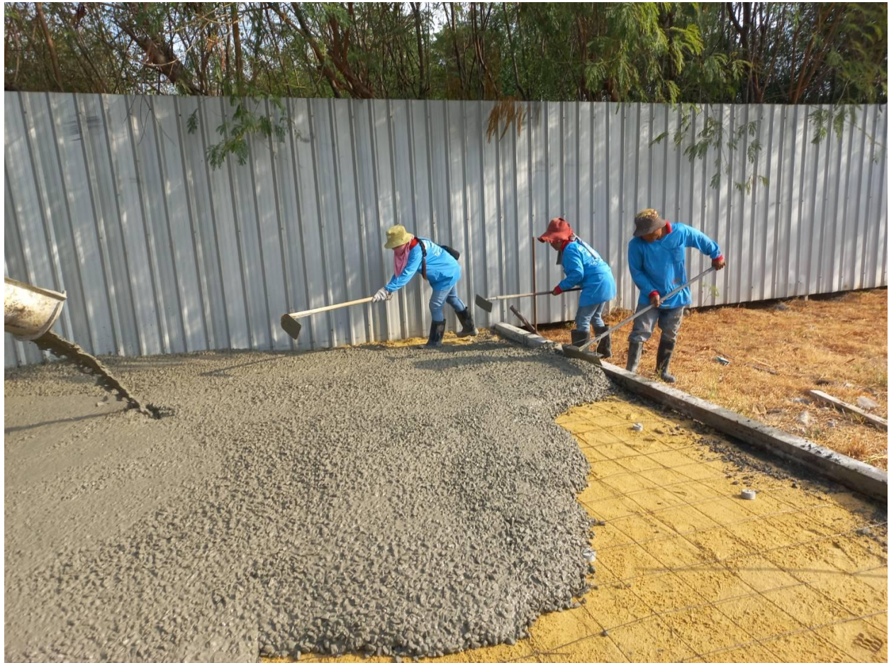
โครงการปรับปรุงสวนสาธารณะชุมชน (CSR-DIW Continuous)