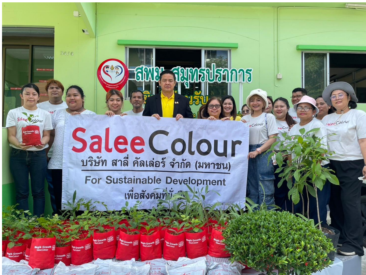
บริจาคต้นแคนาให้กับโรงเรียนปทุมศึกษาและมัธยมศึกษาสมุทรปราการ เขต 1