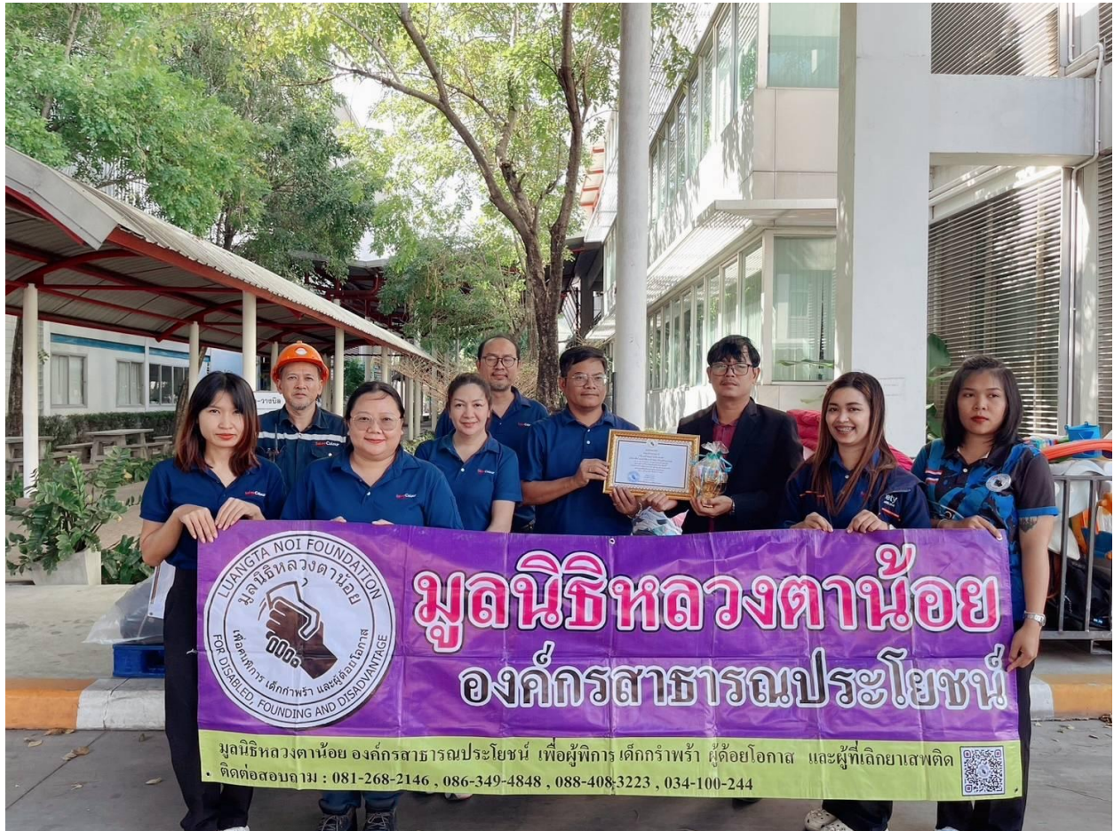
ช่วยเหลือผู้ด้อยโอกาส