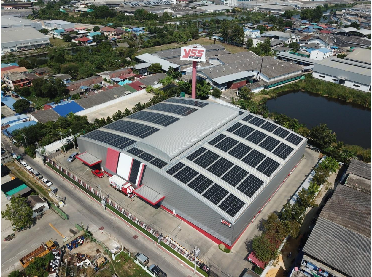
โครงการผลิตไฟฟ้าจากพลังงานแสงอาทิตย์บนหลังคา