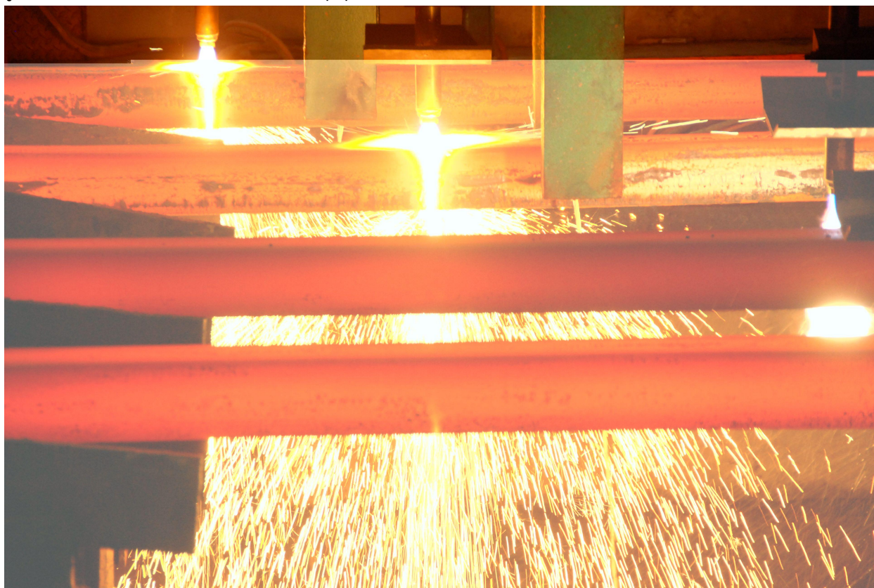
เหล็กแท่งยาว

รูปภาพโครงสร้างรายได้ของสายผลิตภัณฑ์หรือกลุ่มธุรกิจ