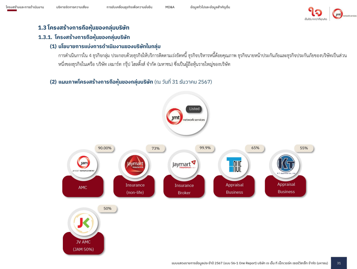
โครงสร้างการถือหุ้นของกลุ่มบริษัท JMT