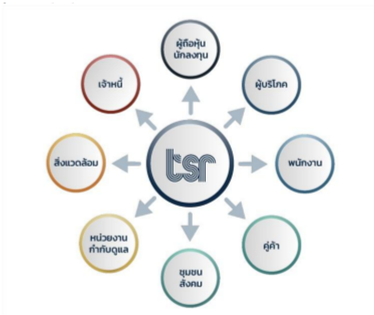
รูปภาพห่วงโซ่มูลค่าธุรกิจ