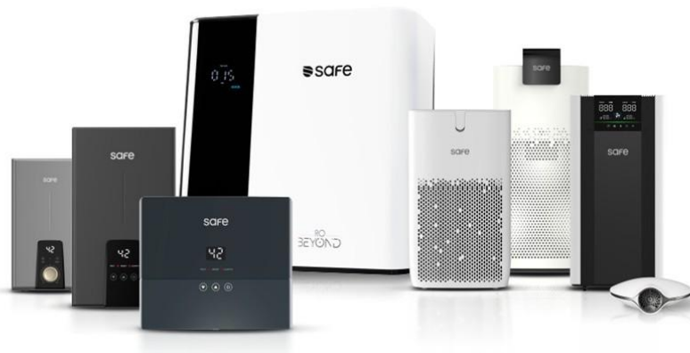
ตัวอย่างผลิตภัณฑ์ของบริษัทภายใต้ แบรินด์ SAFE