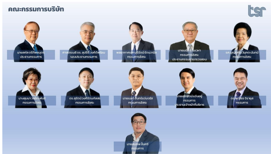
คณะกรรมการบริษัท