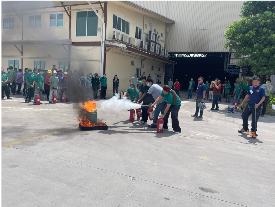
CSR อบรมซ้อมอพยพหนีไฟ ประจำปี 2568