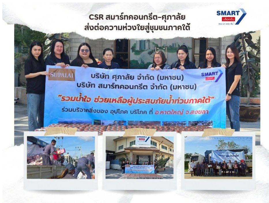
CSR ร่วมสนับสนุนโครงการดีๆ เพื่อรวมใจช่วยเหลือผู้ประสบภัยน้ำท่วมภาคใต้