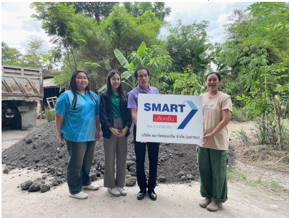
CSR บริจาคซีเมนต์กะลาปาล์ม เพื่อใช้ในการเรียนรู้ ณ ศูนย์กิจกรรมธรรมชาติมาบเื้อง