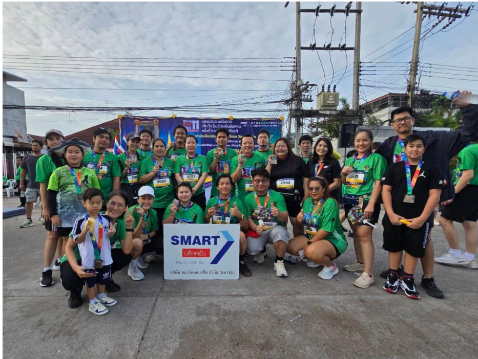
CSR กิจกรรมงานวิ่ง WALK RUN BIKE 11 เพื่อการกุศล 2568