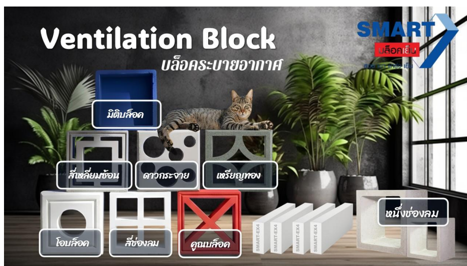
สมาร์ทบล็อก "บล็อกระบายอากาศ"