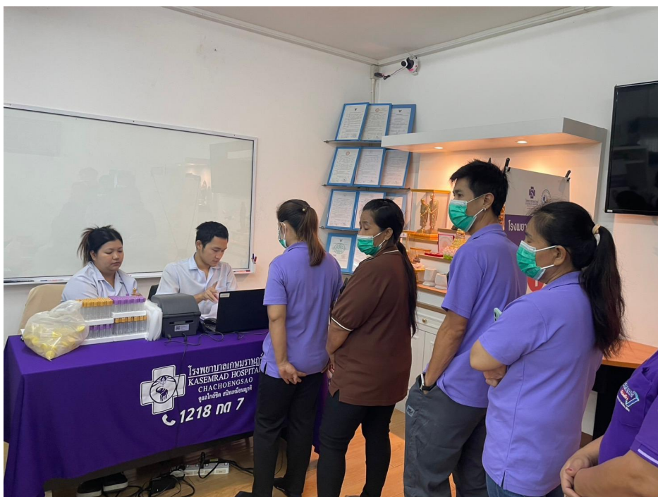
ตรวจสุขภาพประจำปี 2568