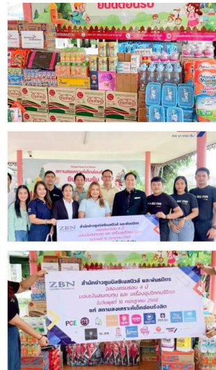
โครงการแบ่งปันอาหารแก่เด็กในสถานสงเคราะห์เด็กอ่อน จ.ปทุมธานี