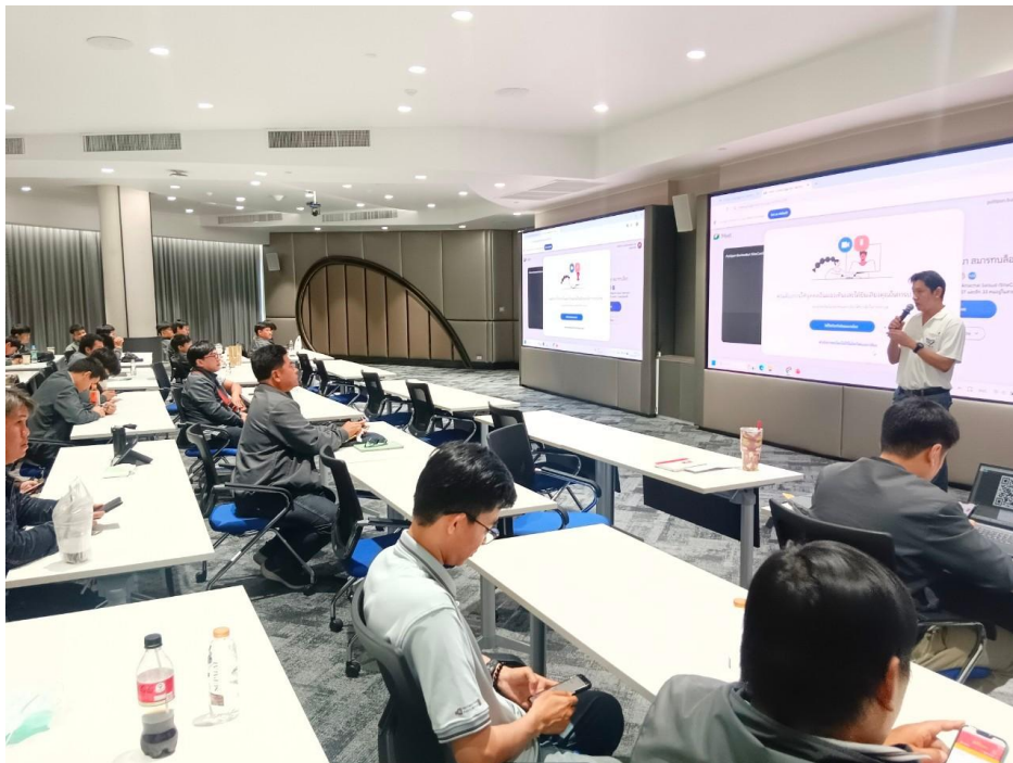
อบรมสัมมนาให้ความรู้กับลูกค้า 2568

ผลการดำเนินงานและผลลัพธ์ด้านการจัดการลูกค้าผ่านการจัดกิจกรรมต่างๆเพื่อให้เกิดความสำเร็จ เช่น การสาธิตการก่อกำเนิดในโซ่งงานลูกค้า การอบรมให้ความรู้กับลูกค้า การสำรวจความพึงพอใจเพื่อสร้างความสัมพันธ์ที่ดี เป็นต้น