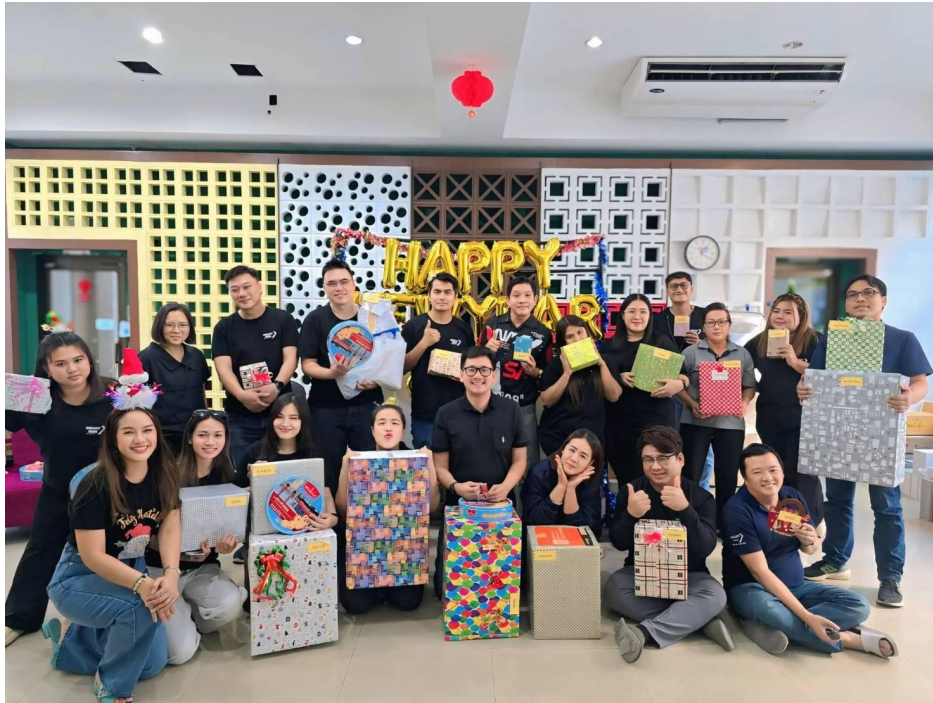
กิจกรรมงานเลี้ยงปีใหม่ของบริษัท 2568