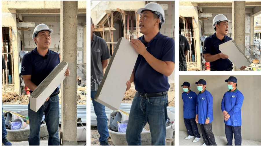
สาริตการก่ออิฐมวลเบา 2568