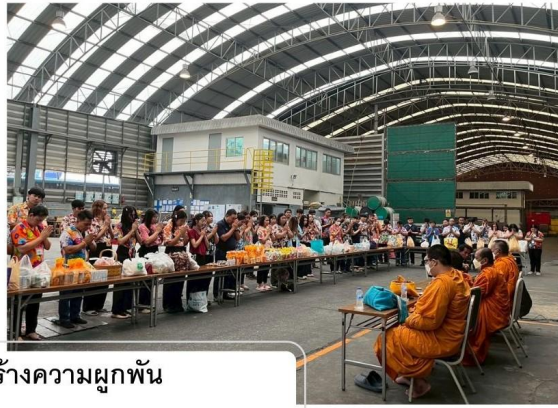
การสร้างคามผูกพัน Employees Engagement