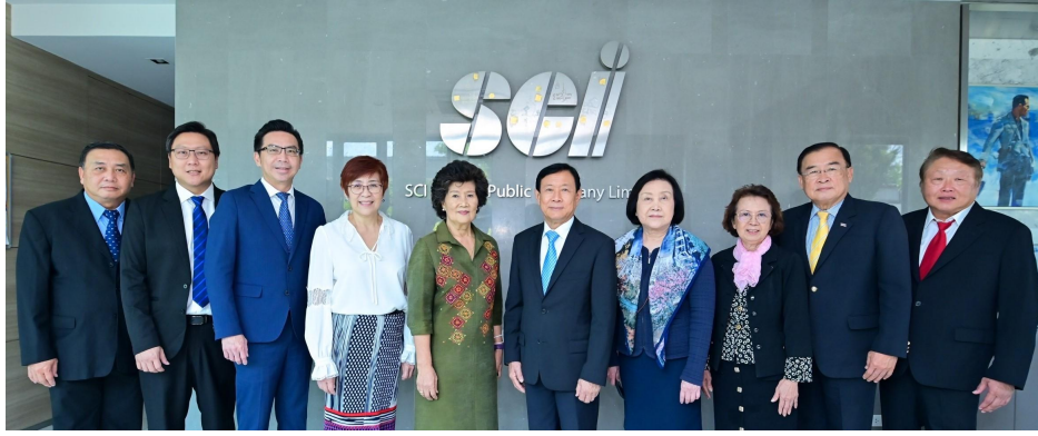
คณะกรรมการบริษัท