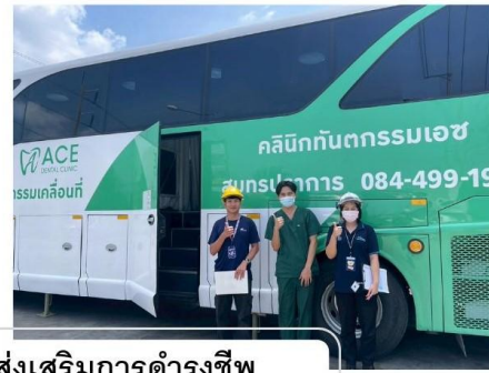
สวัสดิการเพื่อส่งเสริมการดำรงชีพ Welfare to support employees' Quality life