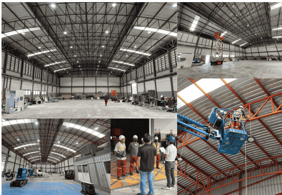
ดำเนินการปรับเปลี่ยนหลอดไฟฟ้าที่เป็นรุ่นเก่าซึ่งใช้กำลังไฟฟ้าสูงเป็นหลอด LED ทั้งในอาคารสำนักงานและโรงงาน Replace old, high-power light bulbs with LED bulbs in both office buildings and factories.